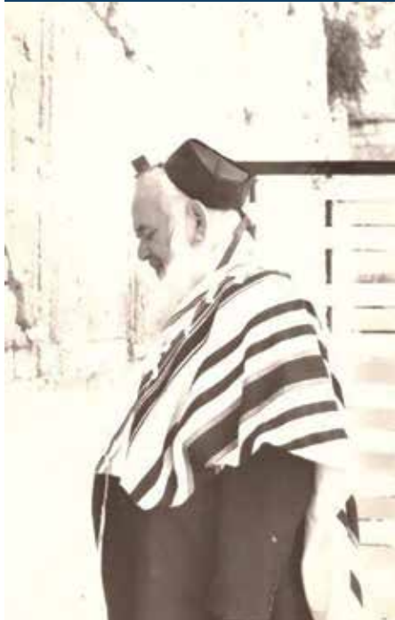
"ולירושלים עירך ברחמים תשוב" - מרן רה"י רבי חיים שמואלביץ זצוק"ל