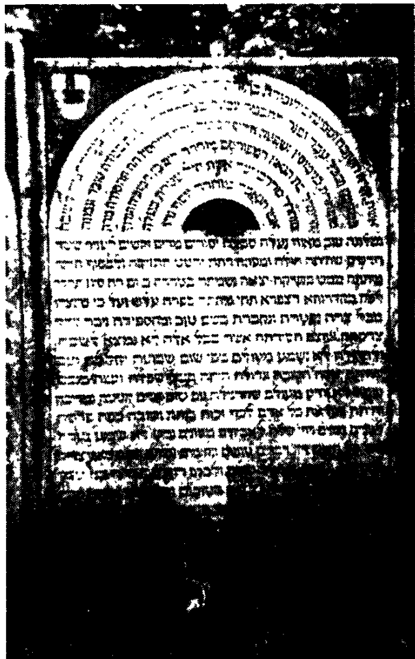
מצבת הרבנית קרינדל שטיינהארט

בני פיורדא סיפרו, היאך פעם לאחר תפילת 'גשם' בשמיני עצרת החלו תיכף לרדת גשמי ברכה. החזן של בית הכנסת 'החדש' בפירדא, לא הסתיר את התרגשותו מכך שתפילתו פעלה זאת. הרבנית קרינדל שלא חיבבה את זחיחות דעתו, החמיאה לו בשנינות: "לא רק גשם מסוגל אתה להוריד, אלא אף להביא את המבול!" 319 שנינה נוספת שהתהלכה בשמה בין יהודי גרמניה, קשורה לימי ילדותה. אביה נכנס פעם לביתו בעת שהילדים הרעישו מתוך מצב רוח מרומם. בבית השתרר שקט מוחלט, מיראת האב. לפתע שמעו את קרינדל הצעירה אומרת: 320 "משנכנס אב – ממעטים בשמחה". 321