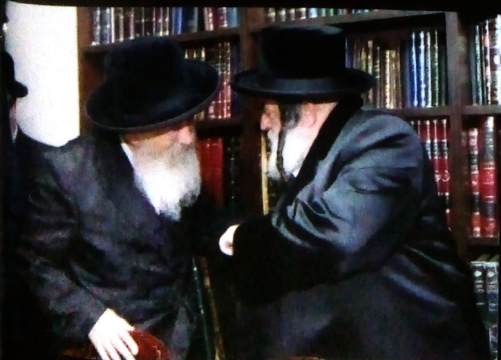
עם יבדלחט"א מו"ח האדמו"ר מוידניץ