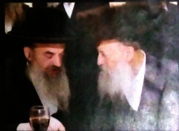
עם יברחמי"א ב"ק האדמו"ר מלעלוב