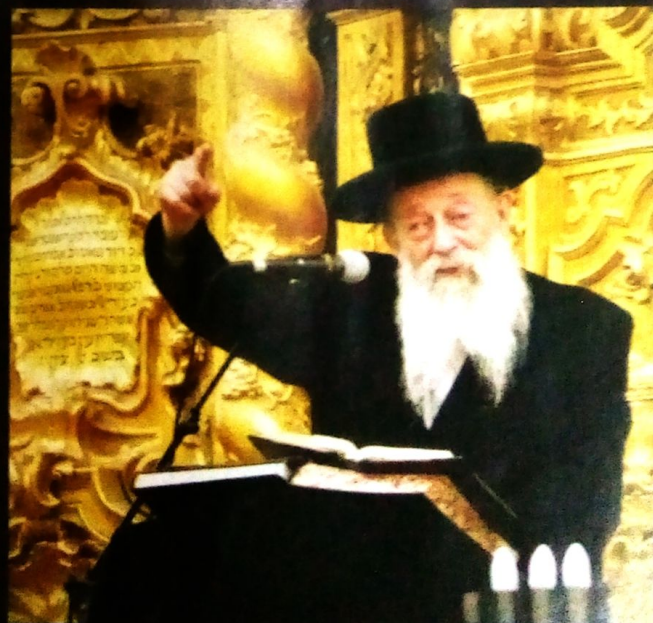
מקובל על כל הקהלים. בישיבת מוניבו

כאשר התקרבו אל 'מחסום חיצמה' שבו ניצבים חיילי משמר הגבול, הרבי הביט עליהם בכאב, ולחש: 'בוא נשיר יחד מ'ה אהבתי תורתך'