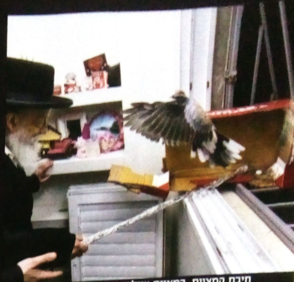
חיבת המצוות. במצוות שילוח הקן

כאביו, בעל 'שבט הלוי', הפליא גם הגר"ח"מ לצעוד בין הטיפות. שניהם ידעו למצוא דרך אל כל המגזרים והחוגים. האב הגדול עמד כידוע בקשרים הדוקים עם בעל ה'ויאל-משה' מסאטמר זצ"ל מחד,