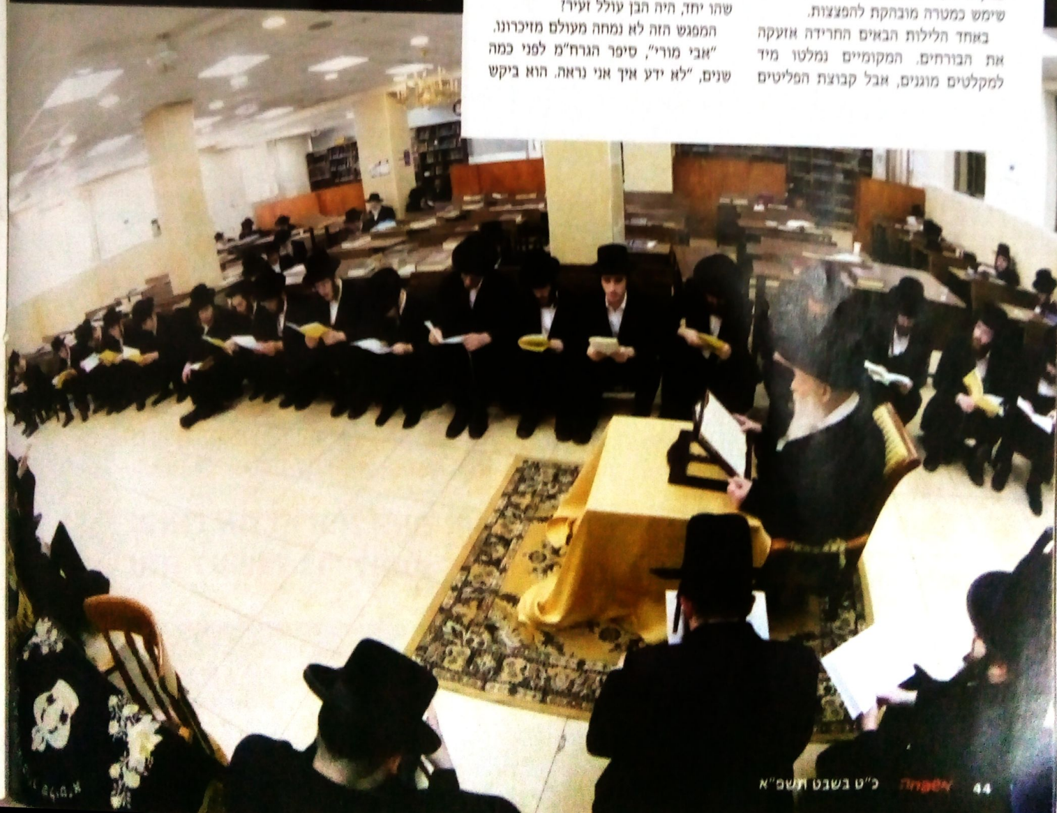
מצר ודואג. באמירת תיקון חצות יחד עם תלמידי הישיבה

נמנייה בסכנה מוחשית. לפתע, כמו משום מקום, הופיעה גוייה מקומית והראתה להם בונקר מכוסה פלדה שהסתתר למרגלות בית החרושת. מבוהלים, מיהרו לקפוץ לתוכו וכך הסתתרו כשמעליהם רועמים פגזים גרמניים.