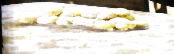
"כל היום היא שיחתי". הגר"מ ברגעי דבקות