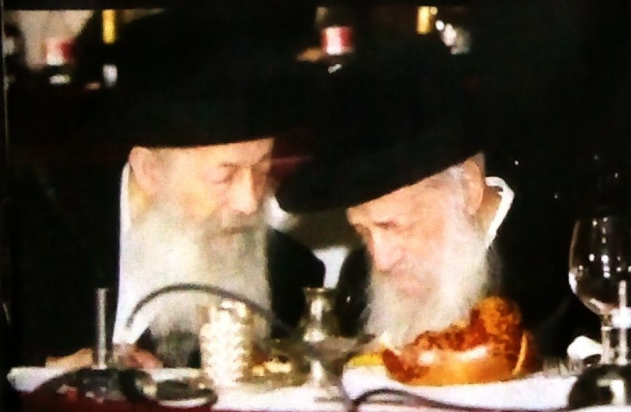
נפשו קשורה בנפשו. עם אביו ה'שבט הלוי' זצ"ל