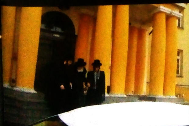
שמעו לי. בביקור בישיבת חכמי לובלין בפולין