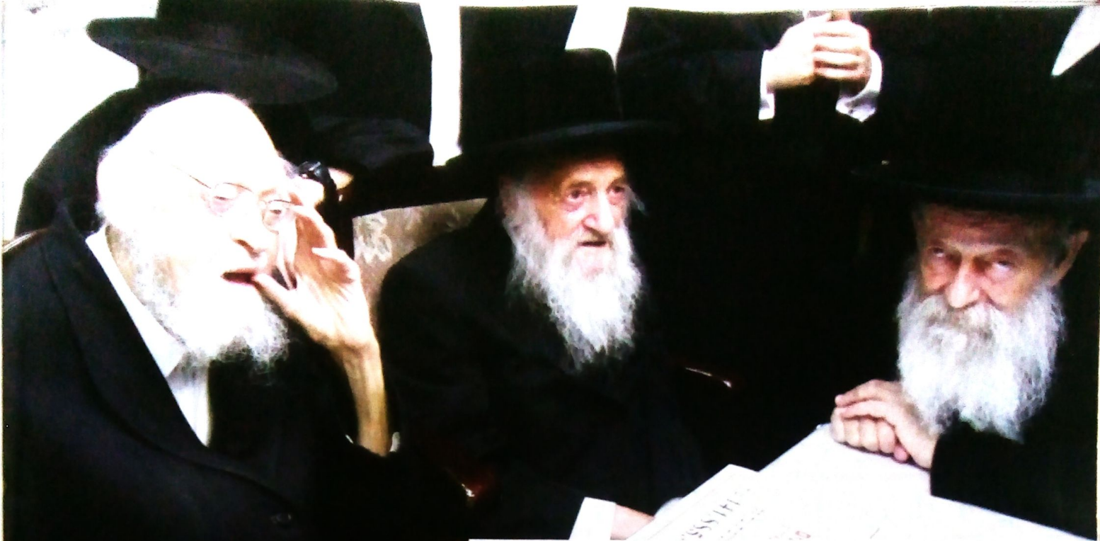
בין פוסקי הדור. עם מרן ה'שבט הלוי והגרי"ש אלישיב זצ"ל

"כשירדתי מהספינה בנמל חיפה ראיתי ספינה קטנה העוברת בסמוך ובתוכה יושב איש עטור בזקן ארוך. חשבתי שזה אבי, אך הוא המשיך דרכו בנסיעה, והתחלתי לבכות מאוד. למעשה היה זה איש אחר. "אחר כך הגיע אבי והכירני לפי התמונה שקיבל ולפי הבגדים שלבשתי. אבל כל אחי ואחיותיי לא הכירו אותי."