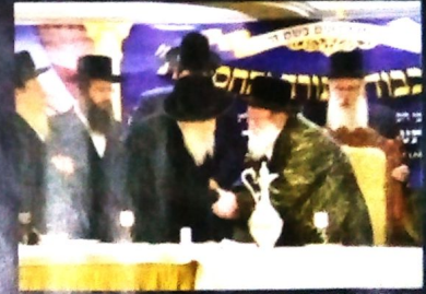
עם כ"ק האדמו"ר מויזניץ