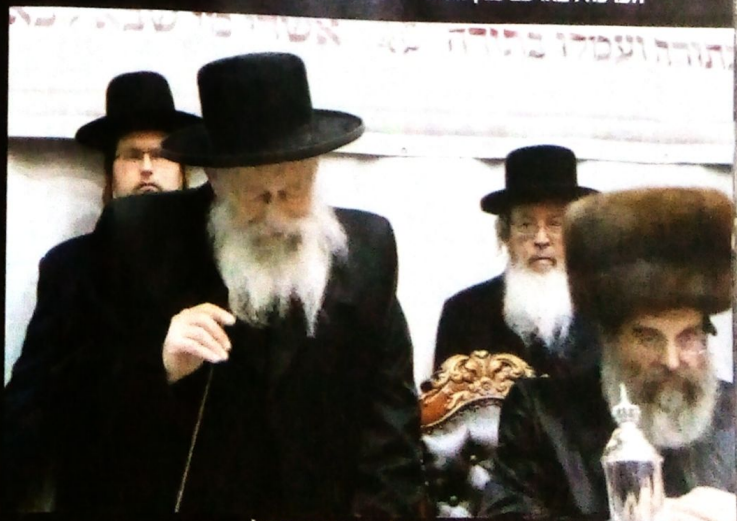
עם האדמו"ר העטרת ישראל מסדיגורה זצ"ל