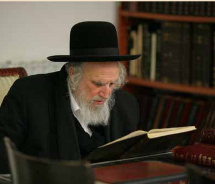
הפקום: מעונו של מרן רבינו הגדול זיע"א. הזמן: זמן פה קודם הדלקת נרות חנוכה. הפעמד: לימוד התורה.

כמוכן ישאלו כולם מה מיוחד בתמונה זו, הלא לחם חוקו ושירת חייו של רבינו היתה התורה הקדושה. אמת ויציב, אך בתמונה זכיתי לצלם חלק נוסף, אף הוא נודע ומפורסם, גדלותו של רבינו זיע"א גם בחלק זה של תורת הקבלה, אותה הסתיר רבינו זיע"א מעין כל. ללא ספק מדובר בתמונה היסטורית, נקל להבחין למי שעדיין לא הבין באותיות המוטבעות על שער הספר: "שער הכוונות".