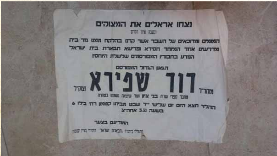
נזר בית מדרשו אחד המיוחד. מודעת אבל על פטירתו של רבנו בביהמ"ד באיאן בקטמון

בירושלים דאז רווח הסיפור על אחד מגדולי ירושלים ששמע בפעם הראשונה את תקיעותיו של רבנו ביום תרועה, והתבטא לאמור: 'כל ימי הייתי מצטער על דברי הנביא (עמוס ג, 1) 'הייתקע שופר בעיר ועם לא יחרדו', האומנם יראים וחרדים כולנו מקולו של השופר? אולם כשזכיתי עתה לשמוע את קול תקיעותיו של