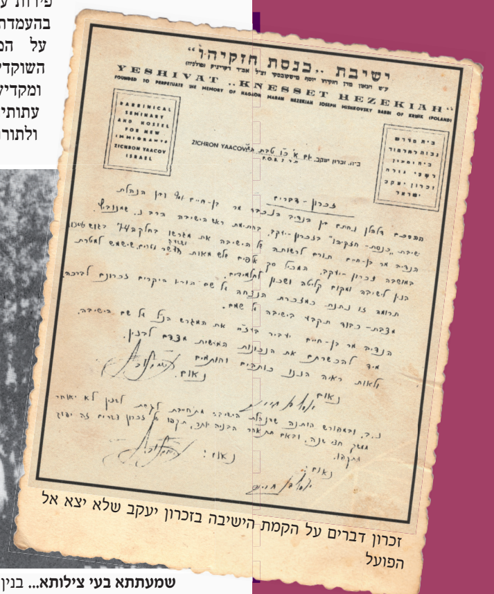
זכרון דברים על הקמת הישיבה בזכרון יעקב שלא יצא אל הפועל

זכה הגר"ח זצ"ל ורישומו הטוב נחרט לדורות באותיות של זהב בדברי ימיה של עולם התורה והישיבות, כאשר פירות עמלו המבורכים בהעמדת הישיבה הק' על המוני תלמידיה השוקדים על תלמודם ומקדישים את כל עתותיהם קודש לה' ולתורתו, בדמותם