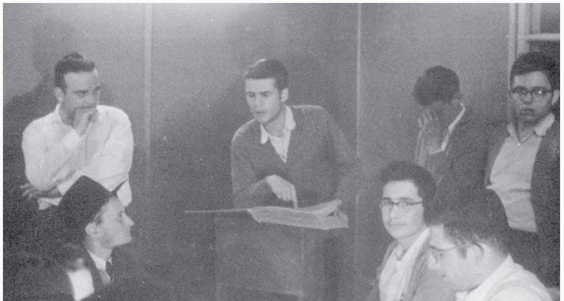
אין לי כח יותר לעלות... תלמיד בישיבה משמיע 'חבורה' בישיבה בכפר חסידים

קודם שהוחלט על המקום המדויק של הישיבה, בא רבנו כדי לתור מקום. השטח היה הררי והטיפוס אליו היה קשה. רבנו עלה ועלה, עד שהגיע לנקודה מסוימת, בה עצר ואמר: לסובביו: "עד כאן, אין לי כוח יותר לעלות". בדברים אלו ניבא ולא ידע מה