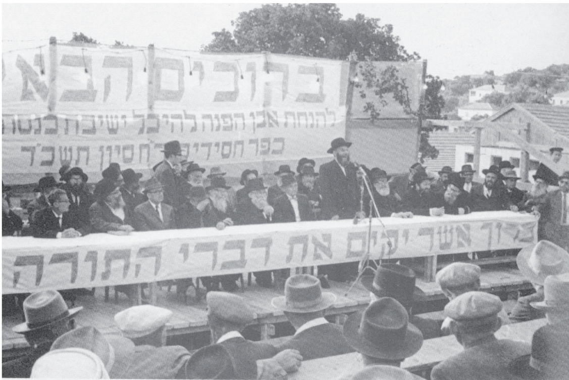
בקשתו האחרונה 'שילמדו בהתמדה רבה'... הנחת אבן הפינה להיכל ישיבת "כנסת חזקיהו" בכפר חסידים

הישיבה בצפון הארץ, היוותה מפנה בתולדות הישיבות בארה"ק שהתרכזו עד אז בי-ם ובב"ב, והנה עתה התפשטה לה התורה אף לצפון הארץ.