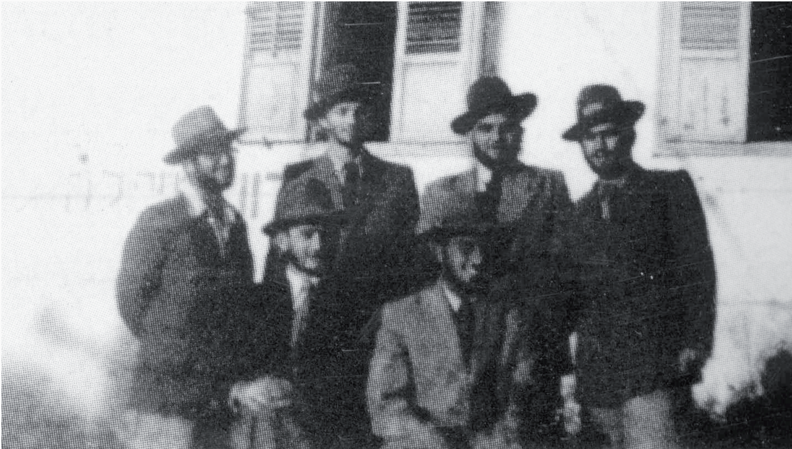
עד מהרה תפסה ישיבת "כנסת חזקיהו" את מקומה בכותל המזרח של עולם הישיבות... קבוצת התלמידים על רקע בניין הפנימיה בזכרון יעקב

קבל את דרכו דרך הלימוד וההבנה האמיתית מרבותיו הגדולים ובייחוד מרבו המובהק הגאון האמיתי רב"ד מקמניץ זצ"ל, ממשיך ומשפיע את התלמידים בשיעוריו העמוקים ובהנהגתו ומידותיו התרומיות באופן היותר מוצלח. בעז"ה אני רואה את התפתחות הישיבה כבר בחזון, תקוותי כי היא תהיה בזמן הקרוב לאחת הישיבות הגדולות בארצנו הק'..."