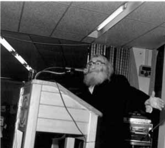
כח השלום והאחדות. רבינו בנאום בכינוס אגודת ישראל בכינר

שם זה, שנקרא בו מרע"ה על שם הגדולות והנפלאות שפעל ועשה, ניתן לו בהיותו 'נער בוכה' (שמות ב, ו). בפרדס יוסף (שמות