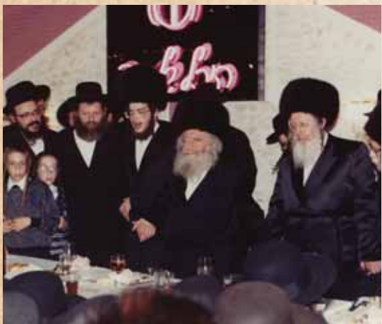
זוכה לתורה. רבינו בשמחת החתונה של בת כ"ק האדמו"ר מגור שליט"א

אלא לפי שחייב אדם לברך על הרעה כשם שמברך על הטובה, א"א לומר ש'כי טוב' היינו 'אי', שהרי תמיד צריך להודות. ואם כן ייאמר, שבמיוחד לכך בחר רש"י 'א פראבלעמ'דיג פסוק', בכדי להזכיר לנו דבר זה.