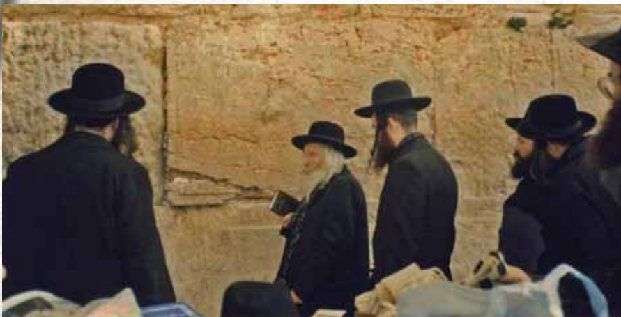
התפעל ביותר. רבינו בכותל עם בניו

שבעה עשר בתמוז, חל באותה שנה ביום השבת והתענית נדחתה ליום ראשון בשבת. אולם הרב מפוניבו' זי"ע הורה לרבנו שעדיין יש לו דין חולה ואסר עליו להתענות ביום התענית. ברם לקראת תשעה באב, הקדים רבנו להתייצב לפני הרב מפוניבו' ולהפציר בו לבל יורה לו שלא להתענות, שכן תהא זו עבורו גזירה שאינו יכול לעמוד בה'. בדוחק