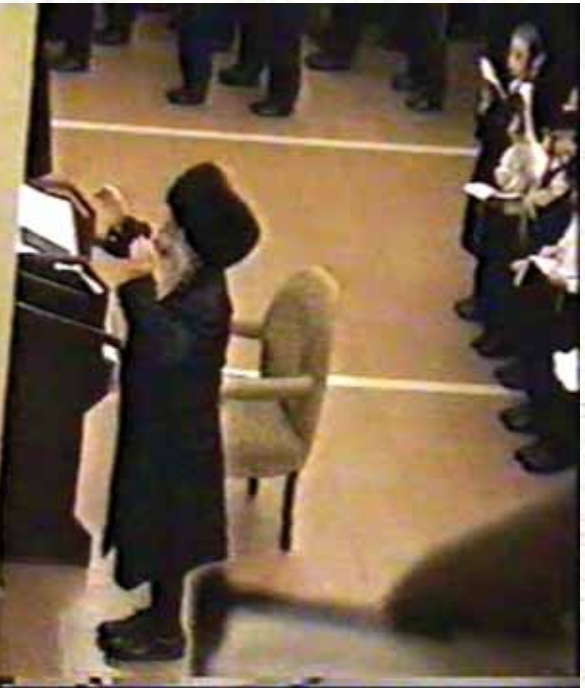
עבד ה'. רבינו בליל הושענא רבה תשנ"ה

תשס"ח, בעת הסעודה, ששמע מבעל המעשה אברך שביקש פעם מרבינו סגולה לעשירות, והשיב לו: "לאחר סעודת שבת בבוקר אל תלך לישון כלל, אלא תלך ללמוד עד מנחה. זו סגולה לעשירות..." כאמור, גם בשבת אחר הצהרים היה עורך 'סינוב' בהיכל הישיבה לפני שירד לביהמ"ד. התחושה היתה: היכן עוד יש בעולם תמריץ גדול מזה? - לעודד את הבחורים להיות נוכחים בשעה זו ולעסוק בתורה בחיות ובשמחה. היו מגיעים לישיבה אף אורחים רבים, בחורים משיבות אחרות, וכן אברכים שהגיעו 'נסיעה' לשבת, לראות ולהיראות. להיות נוכחים במעמד נשגב זה של 'הסינוב'.