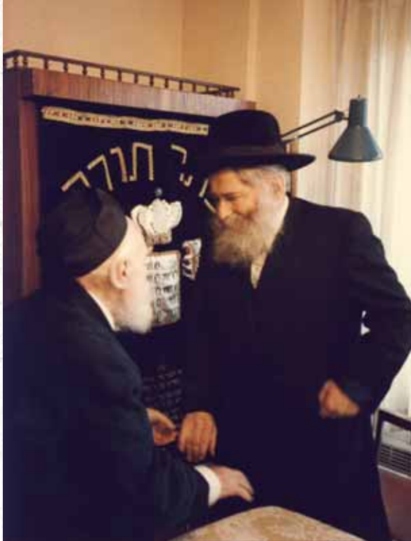
גברא רבה' כצדיקי גור. רבינו עם מרן הגר"מ פינשטיין זצ"ל