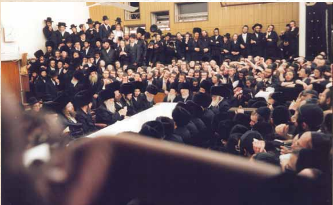
'סדר' חדש בטיש. תמונה נדירה מרבינו בשנת תשנ"ד

בעידן רעווא נשא פעם ידיו וברך בטובו ילד רך שעמד בסמוך לו. הילד התפעל והתרגש, והביע בתמימות באוזני אביו משהו בשבח רבנו. לשמע הדברים חבש רבנו את מגבעתו והתיישב בסמוך לילד - כעומד לגלות באוזניו דבר גדול - ויאמר בחיבה ורגש רב: "דע כי אין בי לא תורה ולא גדולה, אולם היה לי אבא גדול, מכוחו אוכל אף אני להעניק ברכה..."