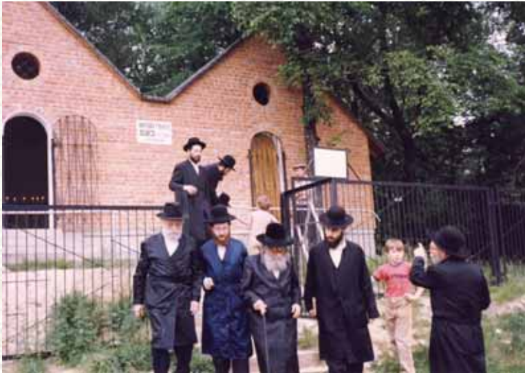
זה אל זה. רבינו על ציונו הק' של הרבי רבי בונים מפרשיסחה זי"ע

חמישה ימים רצופים עמד מוהרי"א למבחן בפני פוסק הדור, כאשר כל יום יוחד לאחד מחלקי השולחן-ערוך, ובעל 'אגרות משה' אינו פוסח אפילו על 'פרי מגדים' נידח אחד. באחת השאלות שנשאל מוהרי"א ענה תשובה מדעית וכיוון בזה לדעת הפמ"ג מבלי שזכר כי הפמ"ג כותב כך. לכשיצא ועמד על דברי הפמ"ג, חזר ובא לבית הגר"מ פינשטיין כדי לומר שהתשובה שענהו, מדעתו ענה אותה ולא מזיכרונו את דברי הפמ"ג ואינו רוצה להיות בבחינת גונב דעת... התרגש הגאון למשמע הדברים, ובפעם הבאה כאשר