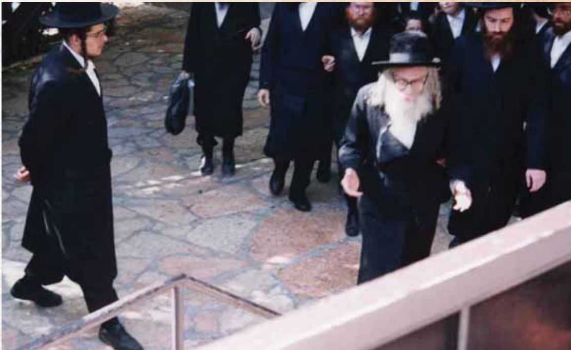
נהנין ממנו עצה ותושיה. רבינו לאחר הכרתו כאדמו"ר, מיד אחר השבועה על כ"ק מרן אדמו"ר ה'לב שמחה" מגור זי"ע

"בב' אדר האחרון, אמר אבי ז"ל שבשנה על פטירת אביו מרן ה'אמרי אמת' רצה להתפלל באותו מניין של מרן ה'בית ישראל' ולומר קדיש, וה'בית ישראל' אמר לו שיתפלל במניין נפרד, ולא מפני שהאבא ה'אמרי אמת' זקוק לזה, אלא כי כשצדיק מסתלק מהעולם נחסרת כה הרבה קדושה בעולם, ולכך צריך להוסיף קדושה. גם כאן כשצדיק נסתלק, נסתלקה קדושה, וצריך באמת להרבות בקדושה".