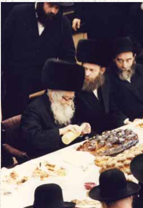
סעודה ומשקה. רבינו מחלק משקה בשמחת נישואין