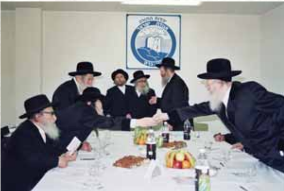
מהותה של אגודת ישראל. רבינו בישיבת מועצת גדולי התורה

אול"ג) מביא בשם קדמונים, שפעם היה גזירה רעה על היהודים, ושלחו משלחת רבנים אל המושל, ואחד הרבנים אמר את דבריו בקול גדול, שאלו המושל: מדוע הינך צועק, וענה אותו הרב למושל: וכי אני זה שצועק, הרי כלל ישראל צועק מגורו! ובוזה מבאר בפרד"י שם את קושיית רבי נחמיה (סוטה יב:): על דברי רבי יהודה שאמר עה"פ 'נער בוכה' - "הוא ילד וקולו כנער" - "א"כ עשיתו למשה רבינו בעל מום" אלא הפירוש הוא כאמור, שעם ישראל הוא זה שצעק מגורו, מרע"ה - בהיותו נשמתם הכוללת של בני ישראל, ובהיותו שר התורה - השמיע את בכיו של עם ישראל, ואת הזעקה לשמור את דרך התורה.