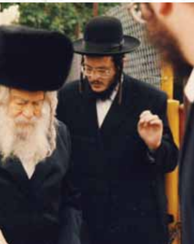
רמזים מופלאים. בהגיעו לקבלת פנים כסלו ת