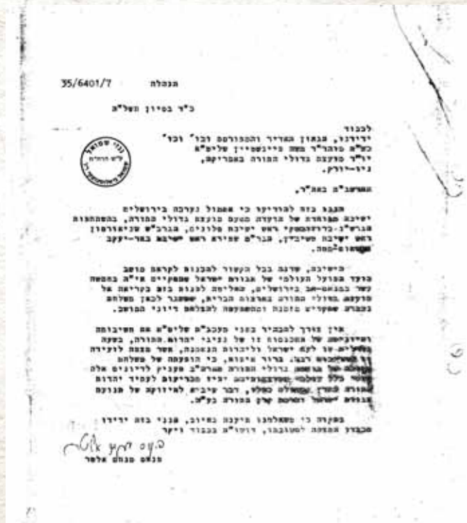
הערכה גדולה. מכתב מרבינו על מרן הגר"מ פיינשטיין וצ"ל

כאן קשר כתרי תורה לראשו של רבנו שישב על שולחן הכבוד ולא התכוון למבול של תשבחות כאלו מפיו של גדול הדור מאמריקה: "בוודאי מעלה גדולה היא להיות צנא מלא ספרא, אבל אין זה אלא כמו ארון ספרים שיכולים להכניס בו גם דברים אחרים, ובכך לקלקל את כל התורה שלמד. גברא רבה' האמיתי הוא מי שראשו מלא ברוחניות כל-כך, שאין מקום לדברים אחרים להיכנס לראשו. את זה עלינו לדעת על האורח שלנו, שהוא כזה גברא רבה' כל אדמו"רי גור היו גברא רבה' בבחינה זו כמו שרואים בספריהם שהתקבלו על כולם. גם אורחנו הדגול כאבותיו הגדולים, אנו יכולים לכנותו בשם 'גברא רבה'. הוא