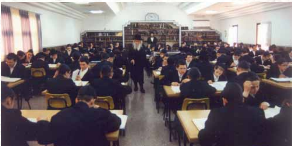
יש מעלה יתירה ללימוד בבית המדרש. רבינו מסתובב בין לומדים

והנה, הרי חז"ל דרשו במדרש "ביום הזה באו מדבר סיני, 'ביום הזה' - בכל יום יהיו בעיניך