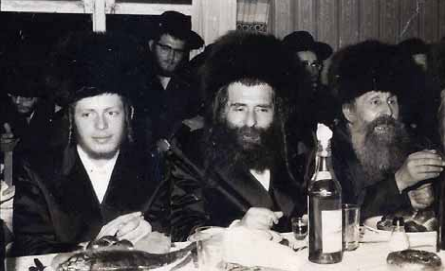
חרדת אלוקים חופפת עליו. רבינו בשמחה משפחתית בצעירותו