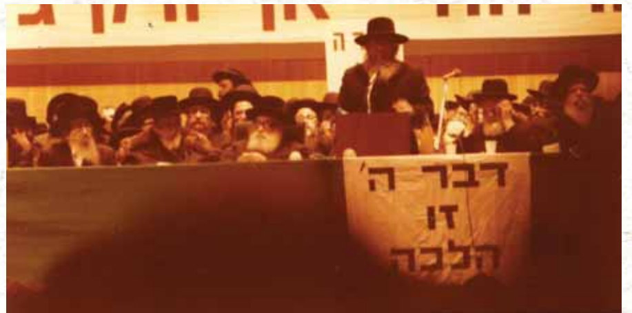
קולו ישמע בשמים. רבינו בכנס לתיקון חוק מיהו יהודי

"...כששב רבנו אל בית אביו ה'אמרי אמת', התעניין אביו הרבי בפרטי פרטים אודות כל ימי שהותו בצל הרב מפוניבו' כשהוא מתעניין אודות הליכותיו של הרב מפוניבו', ומציין: "היה לך להודות בברכת יישר כוח, גם בשמי'..."