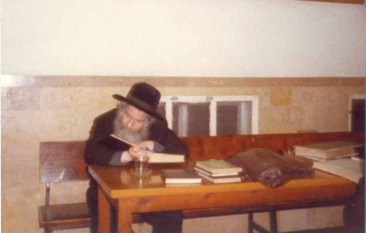
תשע שעות ברציפות. לומד