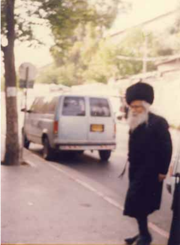
רוממות של שבת קודש. רבינו בהגיעו לבית מדרש בעש"ק

המלים "כי היא מקור הברכה מראש מקדש נסוכה".