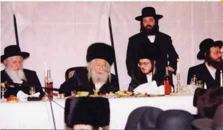
מהחתונות האחרונות שבה השתתף רבינו לנכד הרה"ק ה"אמרי אמת" זי"ע