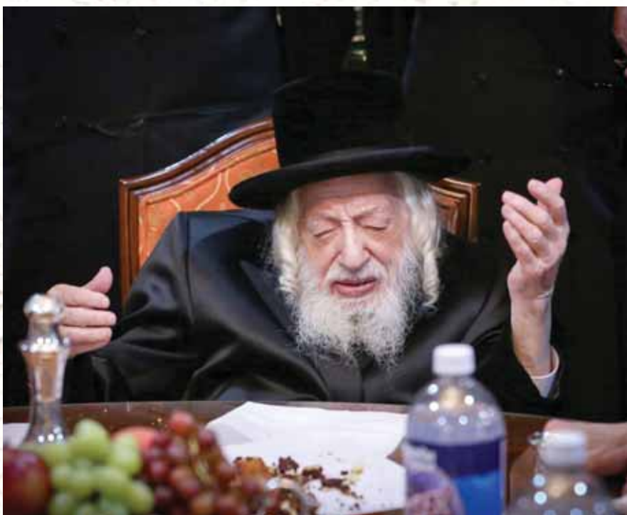
כ"ק מרן אדמו"ר מסקולען זי"ע