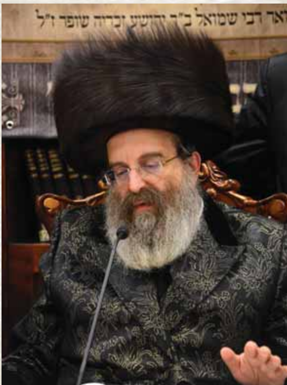
כבו"ק מרן אדמו"ר מסאדיגורה זצ"ל באמרי קודש

אמנם עדיין יש להתבונן מדוע המתין משרע"ה בשבירת הלוחות עד שהגיע למחנה ישראל, הרי עוד קודם שהוריד את הלוחות מן השמים כבר שמע מפי הגבורה (שם ז-ח) "לך רד כי שחת עמך אשר