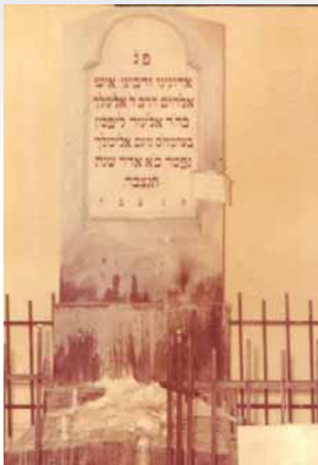
אדם הרוצה לבוא אל הקדושה ופרישות לעבודתו ית', צריך להכניע עצמו בהכנעה גדולה. ציון הרה"ק רבי אלימלך מליזענסק זי"ע

– מצוות פרה-אדומה "לעולם היא נקרא על שמך – 'פרה' שעשה משה במדבר", כפי שפירש"י עה"פ (במדבר יט, ב) "ויקחו אליך פרה אדומה", שכן "עיקר הטהרה היא עץ ארז ואזוב, כמו שאמרו חז"ל: 'שפיל עצמו כאזוב וכתולעת'... שצדיק החטא בא לו מפגם גיאות שהוא שורש כל החטאים... ולזאת עיקר טהרתו בחינת תשובת המשקל היא מדת ענווה ושפלות", ו"למדת ענווה זוכה האדם רק מסיועו ועזר של משרע"ה שהיה עניו מכל האדם אשר על פני האדמה, והוא האיר, והופיע קדושתו וענוותו צדקו לכל מי שרוצים. וזהו 'שנקראת על שמך' – על כוחו".