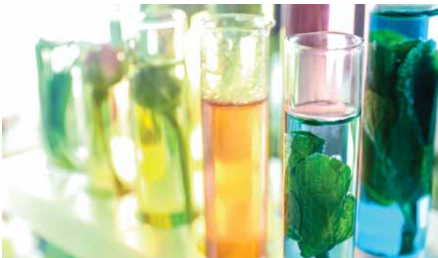
פולמוס רחב בן מאות שנים עוסק בשאלת זיהויו של ה'מר דרור' אם מקורו מהחי ומהצומח. בקבוקי בשמים