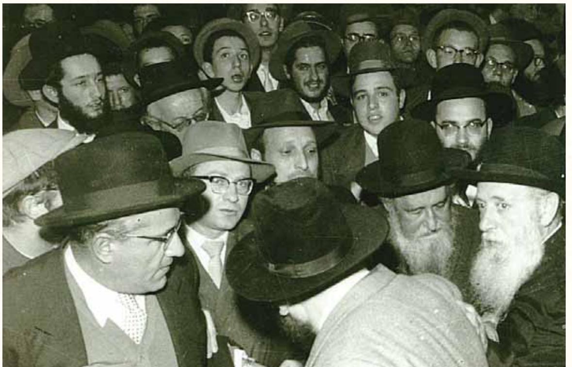
מרן גאב"ד דבריסק זצוק"ל מוקף במלווים בעת בואו לשמחת הנשואין של בנו מרן הגר"מ זצוק"ל

תלמיד נוסף הי' עמו שוחחנו השבוע בהרחבה אודות דמותו הגדולה, מספר לנו על כוחו של מרן הגר"מ זצוק"ל בתפלה. "לא אשכח איך שתמיד התפלל מרן הגר"מ זצ"ל על כלל ישראל בכלליות ובפרטיות, היו לו רשימות ארוכות של אנשים ששפך עליהם נהרות דמעות בגין מצבם הלא משופר ל"ע, יעידו התלמידים כמה זיעה ניגר ממנו גם בימי חורף כשעמל בתורה ק,