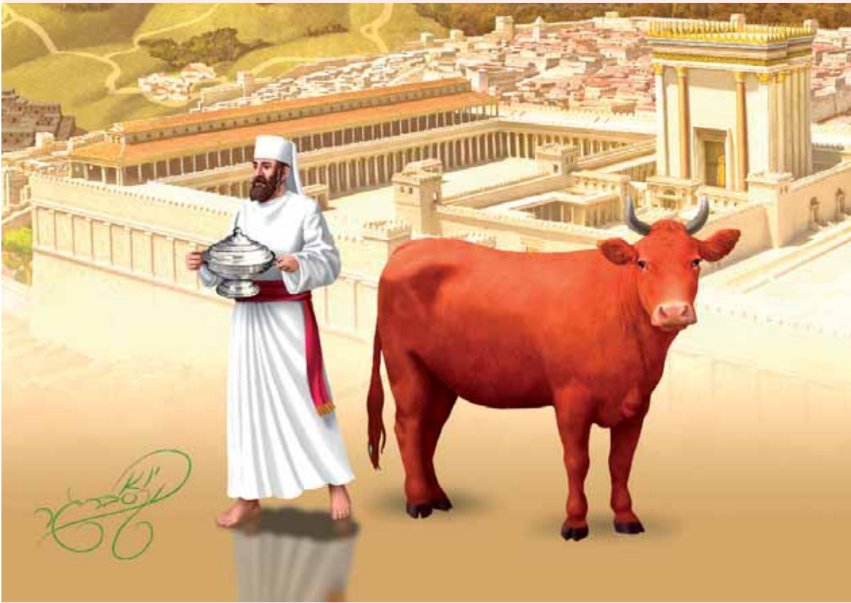
ונשלמה פרים שפתינו. פרה אדומה | מלכות וקסברגר