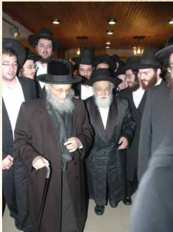
עם גאב"ד העדה החרדית הגר"ט וייס שליט"א

אלו דברים שלא ראינו בהן כל חידוש, וללא כל סיבה גשמית להזיע ככה, אלא רק מיגיעת המוח בתורה, אשרי עין ראתה כל אלה!