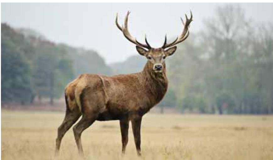
מה מקורו של המור דרור. צבי

למשמעות זיהויו המדויקת של המוס"ק, תהיינה השלכות הלכתיות אותם מעורר הראב"ד בהשגותיו על היד החזקה. הראב"ד מניח הנחת יסוד שהמור שעליו מצביע הרמב"ם, הוא נוזל המופק מדמה של חיה שכלל הנראה היא חיה שאינה טהורה, ועל כך הוא משיג את השגותיו "אין דעתי מקבלת