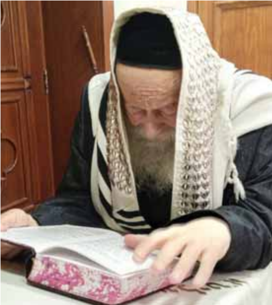
עמקות והתבוננות. רבנו שופך צקון לחשו בתפילה

"בראשית דרכו של אאמו"ר היו אי אלו רבנים שלא כ"כ השלימו עם פסיקותיו בנושאים שונים, אולם ברבות השנים כולם הודו ואמרו שבענייני הוראה ניתן לסמוך על אאמו"ר ללא עוררין כלל, באשר דרכו סלולה וברורה כפי שקיבל