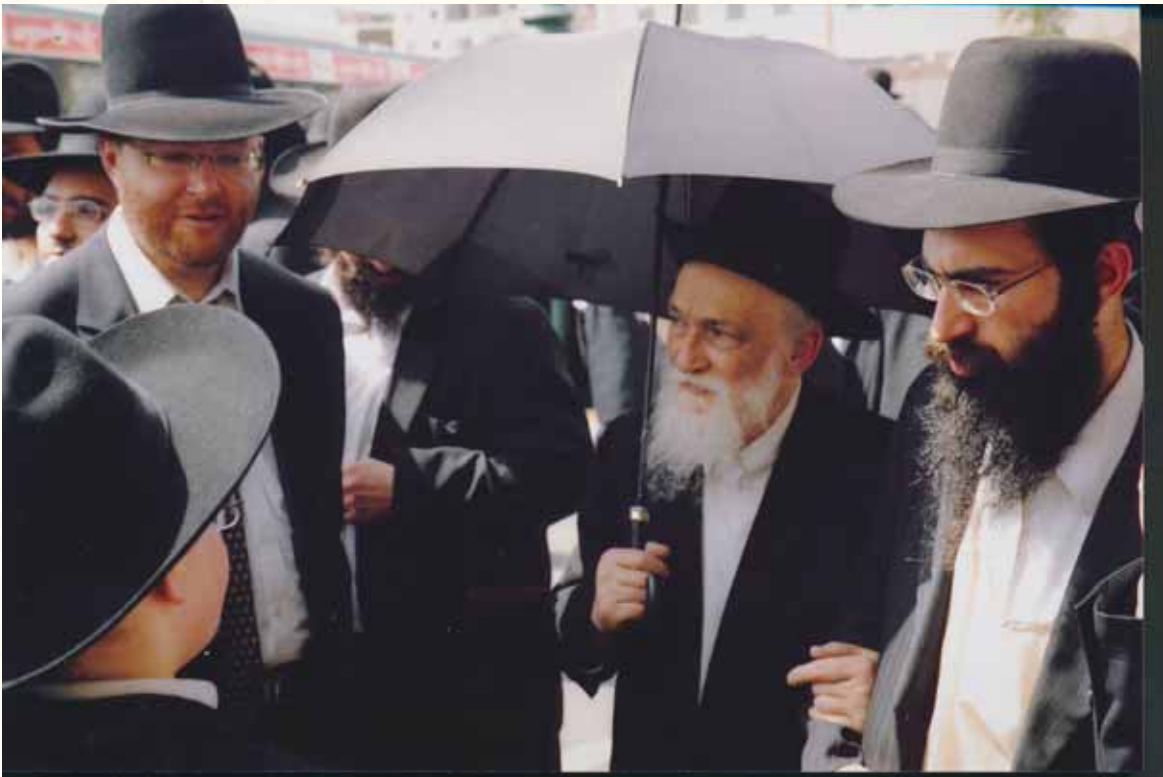
בהלוויית מרן הגרמ"ש שפירא זצ"ל

כך גם הווה עובדה כאשר אחד מבני ביתו סיפר לו כי