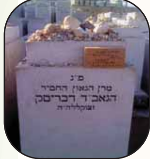
ציון מרנא הרב מבריסק זי"ע

פעם, תחת אחד השיחים, סיפר מרן הגאון רבי אהרן יהודה לייב שטינמן זצוק"ל, כי "בענייני קבורה רואים מעשים מופלאים", וסיפר כמה עובדות על כך, הנה אחת מהן: