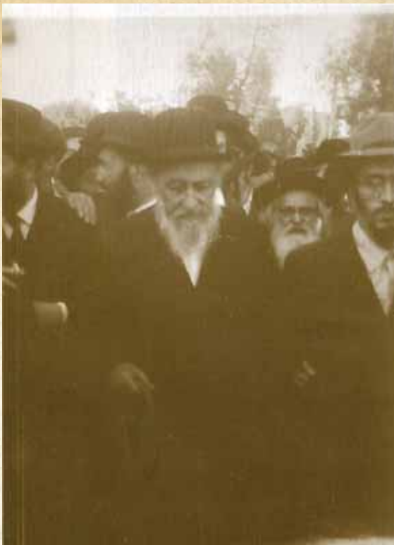
רבנו מלווה את אביו מרן מבריסק זצ"ל בהפגנה נגד הבריכה

כך היה קורא ק"ש לחומרא מדי ערב כמנהג בית בריסק כתשעים ושש דקות לאחר השקיעה, וכל זאת ברוגע ובשמחה יתירה והיה נראה כאדם המאושר עלי אדמות שזכה בזכייה גדולה ונדירה.