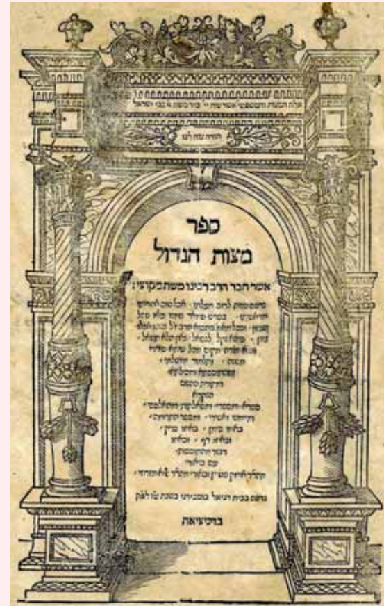
סמ"ג. נדפס בונציה בשנת ש"ז

וכך מאז במשך יותר משבע מאות שנה נלמדים שני הספרים, ספר המצוות לרבי משה מקוצי שנקרא 'ספר מצוות גדול' - סמ"ג, וספר המצוות הקצר - 'עמודי גולה' הידוע בשם סמ"ק.