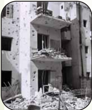
תל אביב בשנת תש"ח

בחדש אדר תש"ז הטיל הצבא הבריטי 'מצור צבאי' על העיר תל אביב