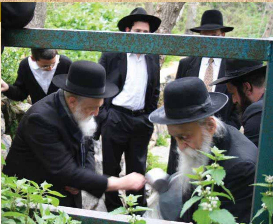
ראשי הישיבות הגרמ"ד והגר"מ סולוביצ'יק בני מרן הרב מבריסק זי"ע בשאיבת מים שלנו לאפיית המצות

"כדרך בית בריסק בישיבתו - ישיבת בריסק שעמדה בראשותו למדו רק מסכתות מסדר קדשים שבש"ס, ועל סדר זה היו נמסרים כל השיעורים בישיבה.