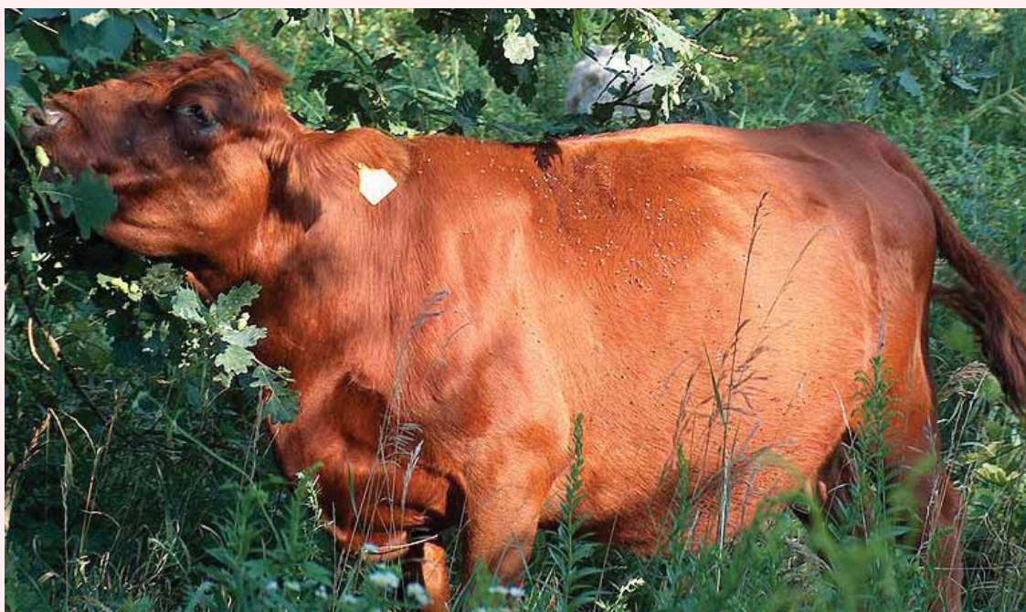
האם קריאת פרשת פרה היא דאורייתא? פרה אדומה

במניין המצוות הלך הסמ"ג על פי הרמב"ם, מלבד בכמה מקומות שחולק על המניין. נציין שבעל הסמ"ג לא הכיר את ספר המצוות להרמב"ם שנכתב בערבית, אלא ראה רק את מניין המצוות שנכתב בתמצית בתחילת ספר המשנה תורה (וכן בתחילת כל קבוצת 'הלכות'). בתוך הספר הוא מזכיר את דברי 'רבינו משה' מאות פעמים, ולצד זה מביא הרבה מספר יראים לרבי אליעזר ממין ומספר התרומה לרבי ברוך מוורמייזא.