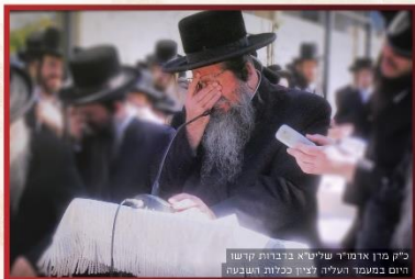
בית מדרש אדמו"ר שליט"א בברכות קדש יום במעמד העליה לציון ככלות השבעה

וכתשובת המשקל אנו מקבלים כאן על עצמנו בלי נדר, להדפיס הכתבי ידות, החידושי תורה בכל המקצועות, כל אחד ואחד ישתדל לכך בכל יכלתו בגוף ובממון. ובזאת ישארו לנו חידושי תורתך, רעיונותך, הדרכותך, להאיר עינינו...)