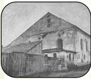
בית הכנסת באפטא

בעיר אפטא פעל שטיבל חסידי בו התפללו בנוסח ספרד, לאחר בואו של הרה"ק בעל 'אוהב ישראל' זי"ע לכהן ברבנות אפטא, החלו להתפלל בביהכ"נ הגדול בעיר בנוסח ספרד וממילא לא היה עוד צורך בשטיבל ההוא, אך כאן התעוררה שאלה מאחר והחסידי, תורם השטיבל, ציוה שחדר זה יישאר 'שטיבל' גם לאחר פטירתו, אך יורשיו טענו כי אילו המוריש היה חי היה מבטל צוואתו, שכן כבר אין צורך בשטיבל זה. הרה"ק מאפטא סירב לדון בשאלה זו שהרי הענין נוגע לכל בני העיר ואין דנים בה בדייני אותה העיר (שו"ע חו"מ סי' ז) לפיכך הפנו הדיינים בראשות רבינו את השאלה אל הגאונים רבי דוב בער ראפאפורט מצוויזמיר ורבי יוסף הויכגלערנטער מזאמושטש בעל 'משנת חכמים', רד"ב מצוויזמיר פסק להתיר, ואילו רבי יוסף הויכגלערנטער אסר, זה היה בשנת תקס"ג. בשנת תקס"ה חזר הרה"ק מאפטא ושאל את הרד"ב מצוויזמיר לדעתו וביום ח' באייר תקס"ה הוא השיב וחזר על דעתו להתיר (אור הגנוז לצדיקים).