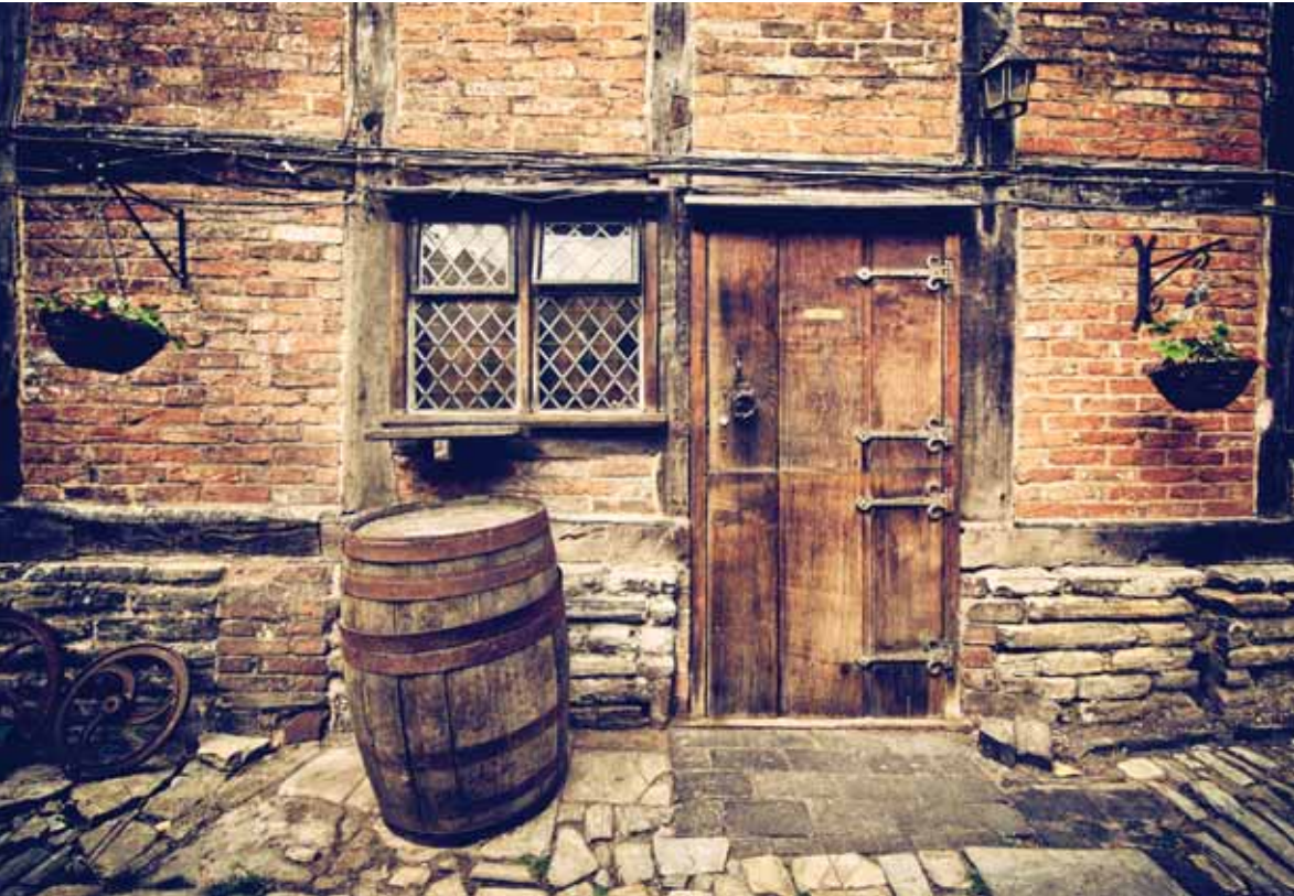
כניסה לבית מרזח עתיק