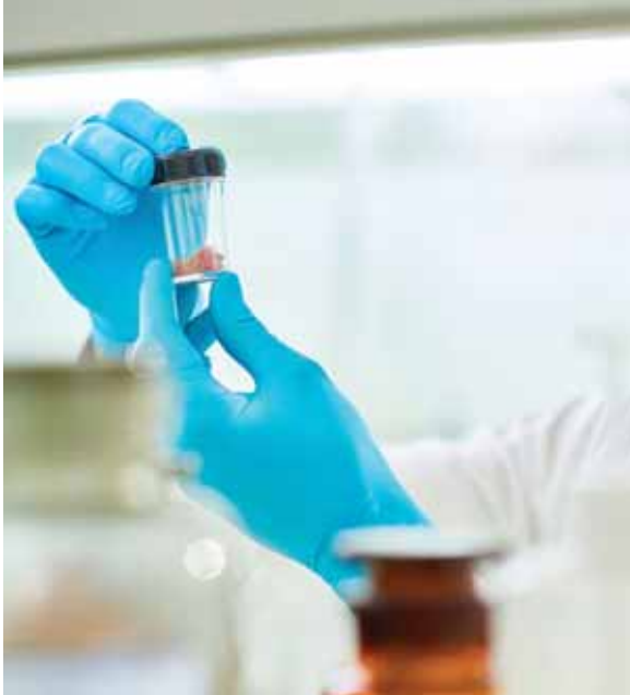
בשר מלאכותי באמצע התהליך המעבדתי.

אולם במקרה של דבר שנוצר בלי התערבות יד אדם – אף אם