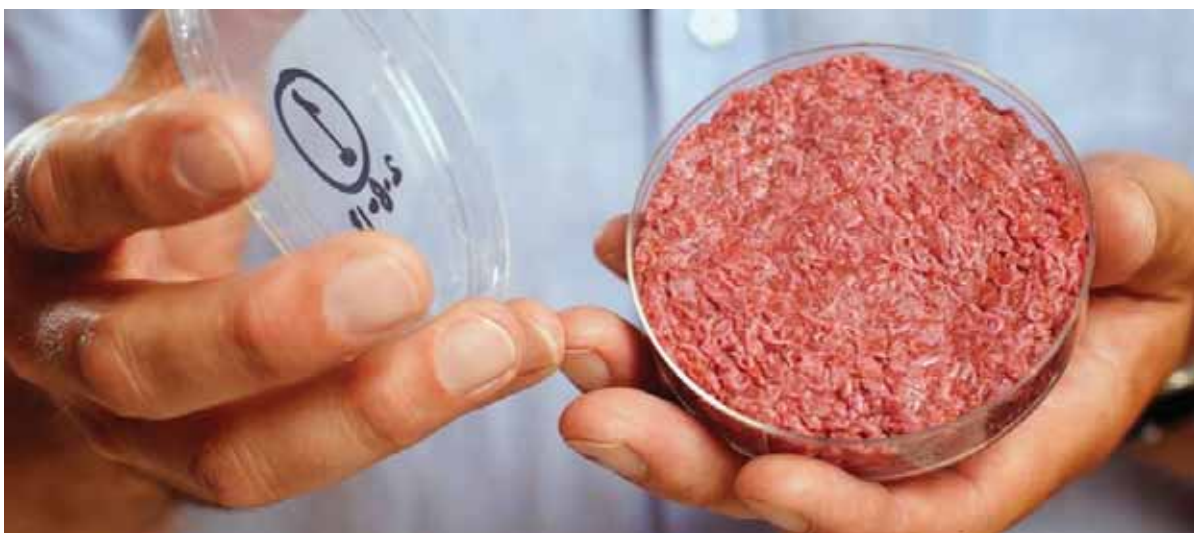
בשר מלאכותי טחון המוכן לטיגון כקציצה.

נדרש אפוא פתרון משמעותי יותר שיחליף את מקור הבשר