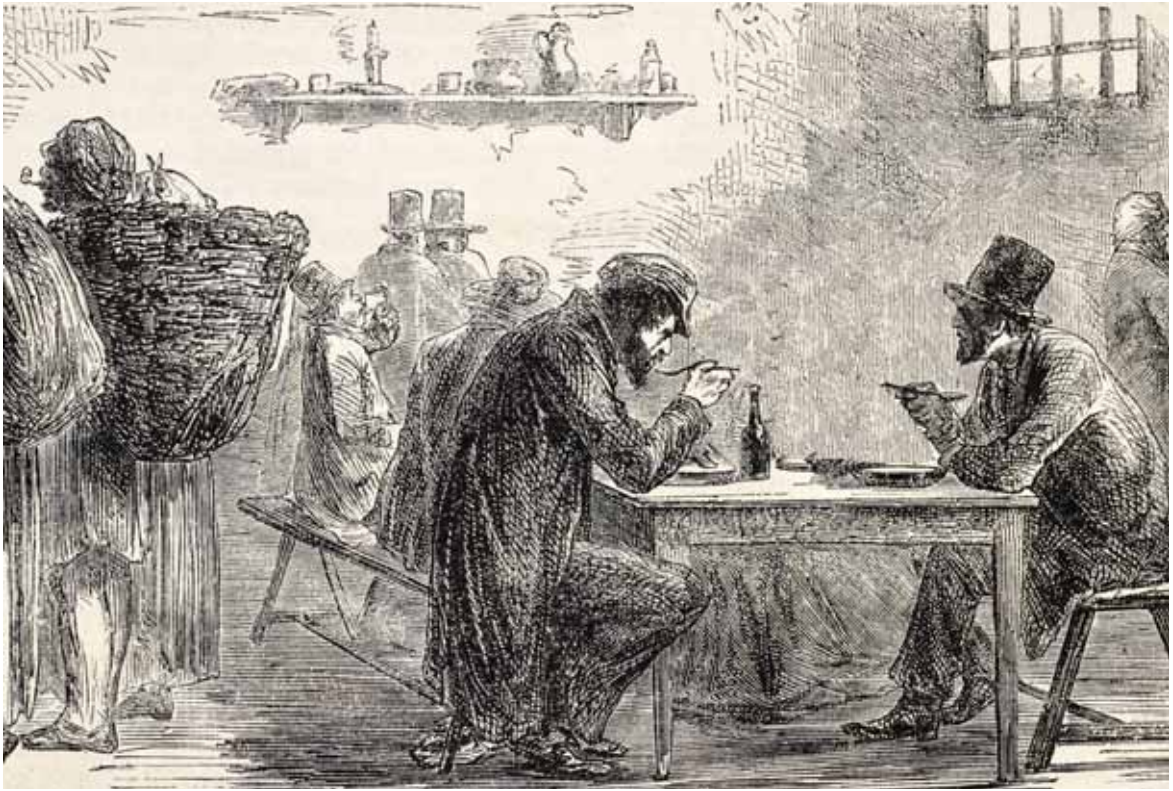
פולמוס של צדיקים. קרעטשמע

ביום הכיפורים של אותה השנה, שהה רבי נחמן קדישא בזלאטיפולי והיתקלות הייתה לו עם החזן המקומי. החזן ניגש ועבר לפני התיבה בניגוד לרצון הקודש, מה שהפריע לתפילתו של הרבי, ובאמצע תפילת נעילה, השתתק החזן באמצע סלסולו הקולני ויותר לא הצליח להוציא הגה מפיו, עד שהוכרח להסתלק מעמוד התפילה בבושת פנים. ככלות היום הקדוש הסביר רבי נחמן: "רציתי לעסוק בתפילה אודות גזירת גירוש הכפרים, והסטרא-אחרא עמד בכל כוחו למנוע ולבלבל את תפילתו ושיגר את אותו חזן שיפריעני בתפילתי עד שהייתי מוכרח לגרום לו