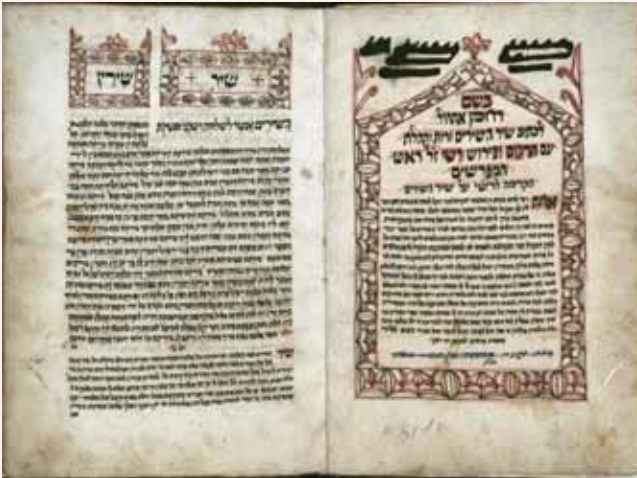
שער ודף ראשון של פירוש רש"י על שיר השירים

לסיום עניין זה נביא מדברי הרמב"ם בחיבורו ההלכתי הי"ד החזקה (הלכות תשובה פרק י, הלכה ג), שכתב אודות אהבת ה': וכיצד היא האהבה הראויה הוא שאהב את ה' אהבה גדולה יתירה עזה מאוד עד שתהא נפשו קשורה באהבת ה' ונמצא שוגה בה תמיד כאילו חולה חולי האהבה שאין דעתו פנויה מאהבת אותה אשה, והוא שוגה בה תמיד בין בשבתו בין בקומו בין בשעה שהוא אוכל ושותה יתר מזה תהיה אהבת ה' בלב אוהביו שוגים בה תמיד כמו שציונו בכל לבבך ובכל נפשך והוא ששלמה אמר דרך משל כי חולת אהבה אני, וכל שיר השירים משל הוא לעניין זה.