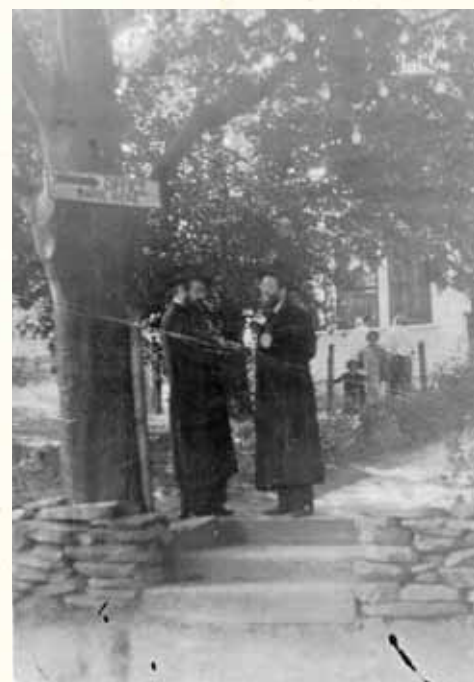
לימוד תורה במסירות נפש. רבינו עם כ"ק מרן אדמו"ר מבאיאן זיע"א