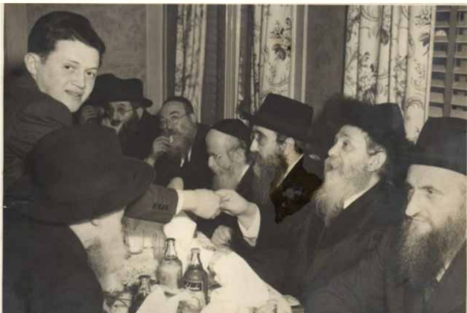
רוח חיים בעצמות היבשות. רבינו משמאל עם כ"ק מרן האדמו"רים מקאפישניץ, באיאן וטאלנא זיע"א

באומרו דברים אלו, לא היה נוכח בנו הרה"ק רבי