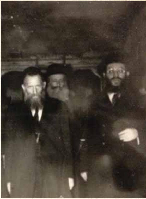
גן עדן עלי אדמות. רבינו עם מקורבים בשמחת נישואין

באותם רגעים נעלים של 'כל מקדש' היו הדמעות זולגות מעיניי