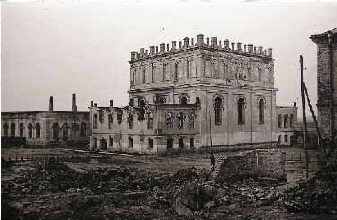
בית מדרש בעלזא בעיירה