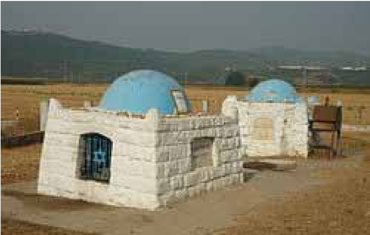
צינום של רבי שמעון בן חלפתא ושל אביו רבי חלפתא ואחיו רבי יוסי.

– שלא כדרך הטבע – אינו סיבה מספקת בכדי להתיר את הבשר באכילה, וגם מוצר שנוצר באופן ניסי – אם דומה בכל תכונותיו ומרכיביו למקבילו הטבעי – דינו שווה, וחלים עליו כל דיני התורה שנאמרו כלפי מקבילו.