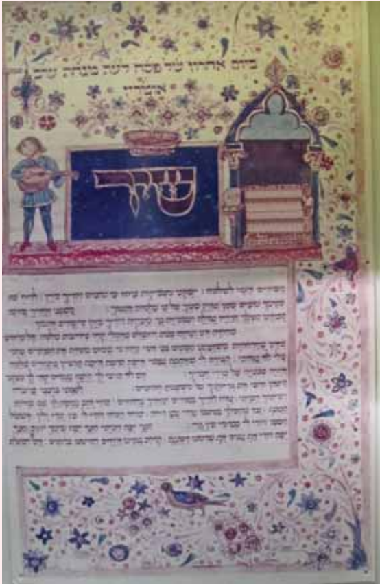
שיר השירים עתיק מאויר ממחזור רוטשילד

עד פטירת לוי עברו 283 שנה (137+86+60=283)), ובמשך 117 שנה השתעבדו עד מלאות ארבע מאות שנה. החיד"א כדרכו מביא בספריו רמזים רבים וביאורים על פי זה, שמניין שנות השעבוד היה 117 גימטרייה 'בחזק', ובמיוחד בכמה מלשונות ההגדה של פסח, וכן מבאר בזה את טעם אמירת שיר השירים בליל פסח].