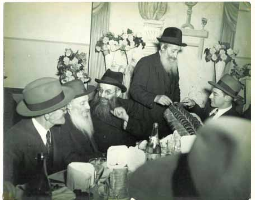
דמות פלא. תמונה נדירה בה נראה רבינו משתף בשמחה לאחד מחסידיו