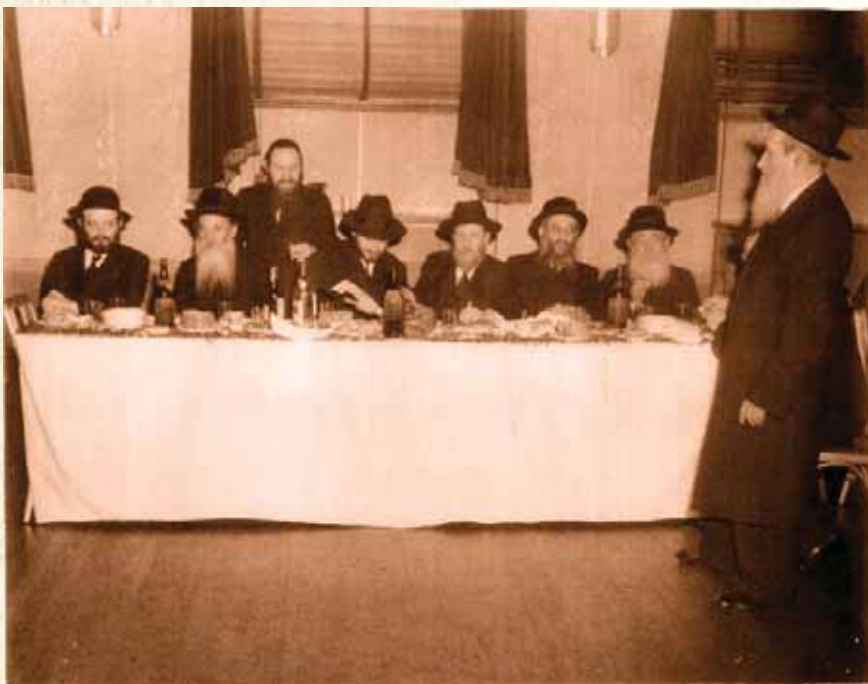
לפידי אש. רבינו בשמחה, נראה משמאל כ"ק אדמו"ר מליובאוויטש זיע"ע