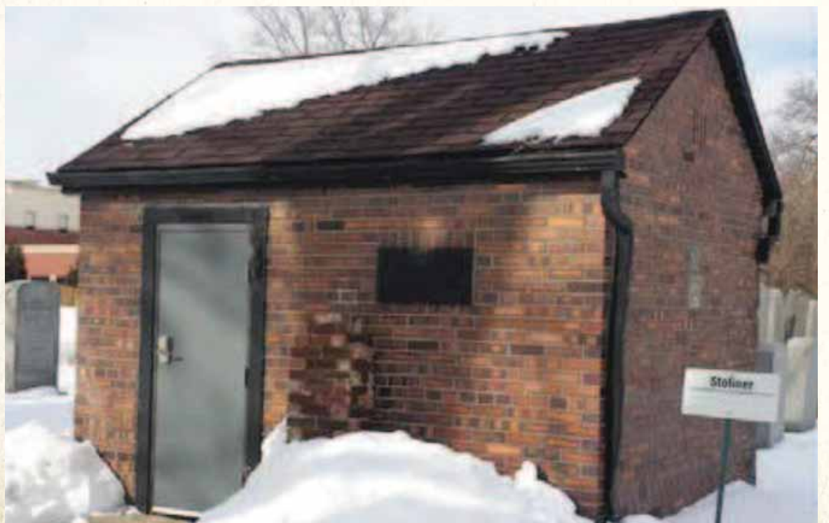
השליחות שנשכחה. האוהל על ציון רבינו

רבנו כעס עליו וייסר אותו בדברים כיצד מסוגל הוא