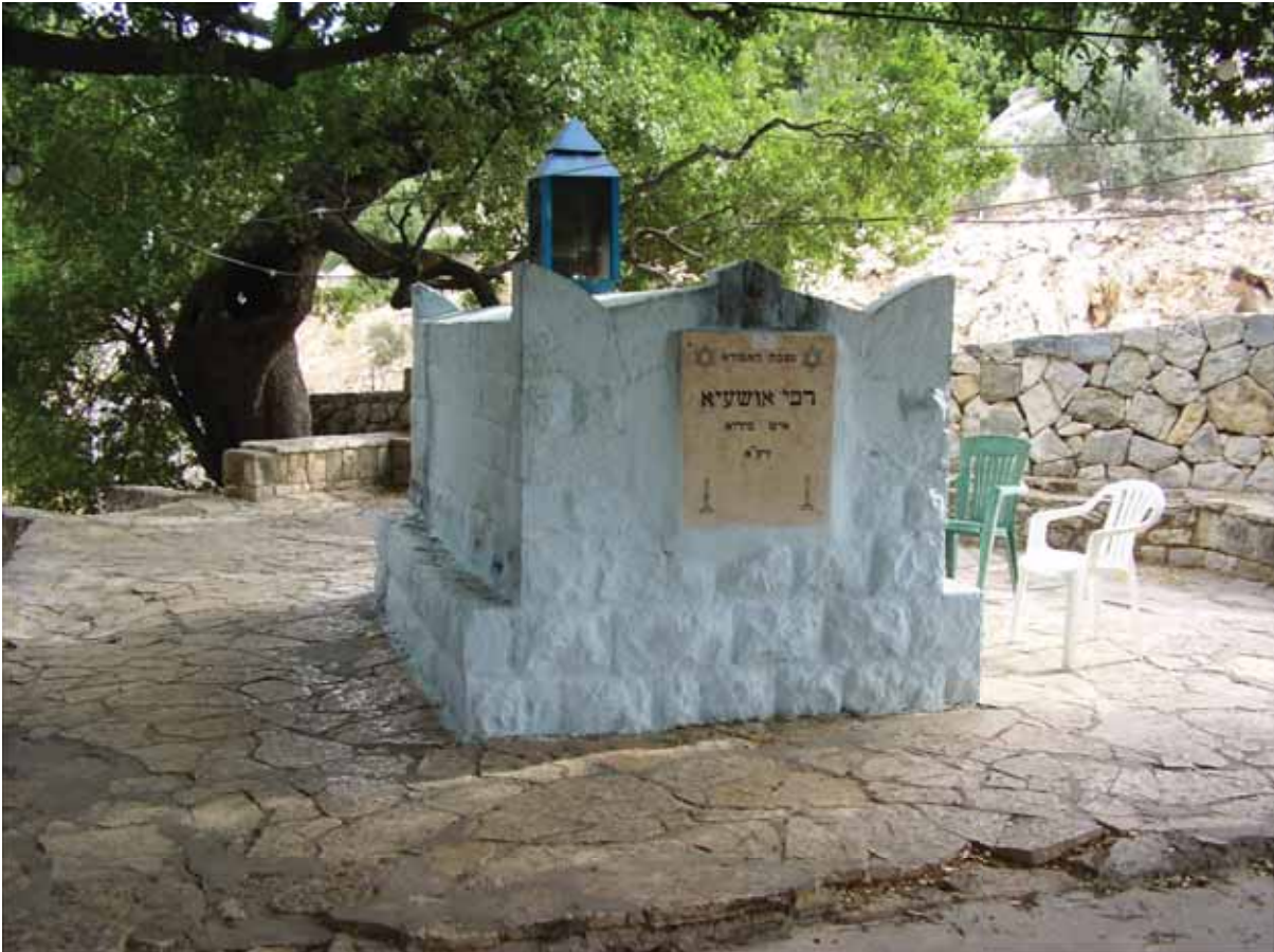
צינון של רב אושעיא.

האם מותר לאוכלו או לא? השיבוהו בני בית המדרש: "אין דבר טמא יורד מן השמים!" כלומר, אפשר לאכול את הירך הניסי בבטחה, מתוך הנחה כי בוודאי לא ירד מן השמים דבר טמא. שנים אחר כך הסתפק האמורא ר' זירא בתשובת בני בית המדרש, הוא שאל את ר' אבהו מה יהיה הדין במקרה ש"ירדה לו דמות חמור" – כאשר חזותו של הבשר שירד מן השמים מוכיח עליו שהוא מבעל חיים טמא. האם גם אז יהיה מותר לאוכלו. ר' אבהו ענה לו בתקיפות יתירה: "יארוד נאלא – תנין שוטה! הא אמרי ליה אין דבר טמא יורד מן השמים!" ומפרש רש"י: "ודבר שאינו הוא – שירד דמות חמור מן השמים – ואם ישנו – טהור הוא!" יש להסתפק בכוונת התשובה 'אין דבר טמא יורד מן השמים' – אם שבשמים לא נוצרים דברים טמאים, או שמא הכוונה היא שמן השמים לא יורידו מוצרים טמאים שעלולים להכשיל בני אדם. כך או כך, המשמעות היא שיש לבטוח שדבר שירד מן השמים – טהור הוא ומותר באכילה. ויש לתמוה למה הוצרכו לכלל הזה, הרי בשר שנוצר באופן ניסי אינו מוגדר כ'בשר' לגבי דיני התורה, ולא שייך בו כלל 'טומאה' ו'טהרה', שהרי מדובר על מוצר אחר לגמרי ממה שהתורה דיברה עליו, וממילא מותר הוא באכילה!? לכאורה, מדברי הגמרא כאן – שהוצרכו לכלל של 'אין דבר טמא יורד מן השמים' – נראה ברור שעצם יצירתו של הבשר באופן ניסי