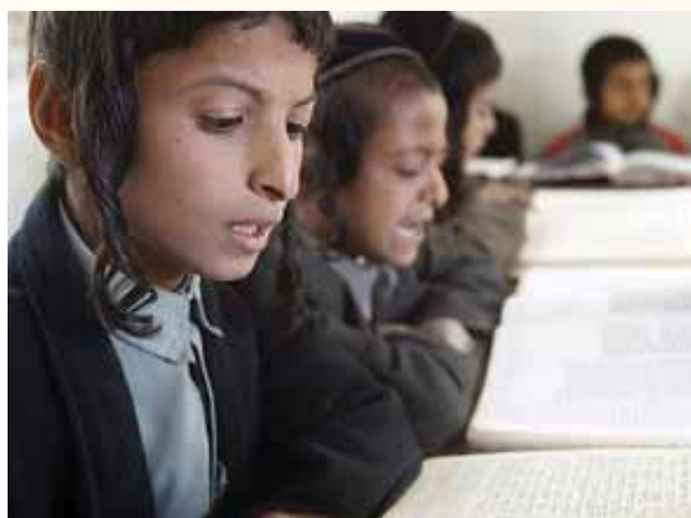
ושננתם לבניך אלו התלמידים