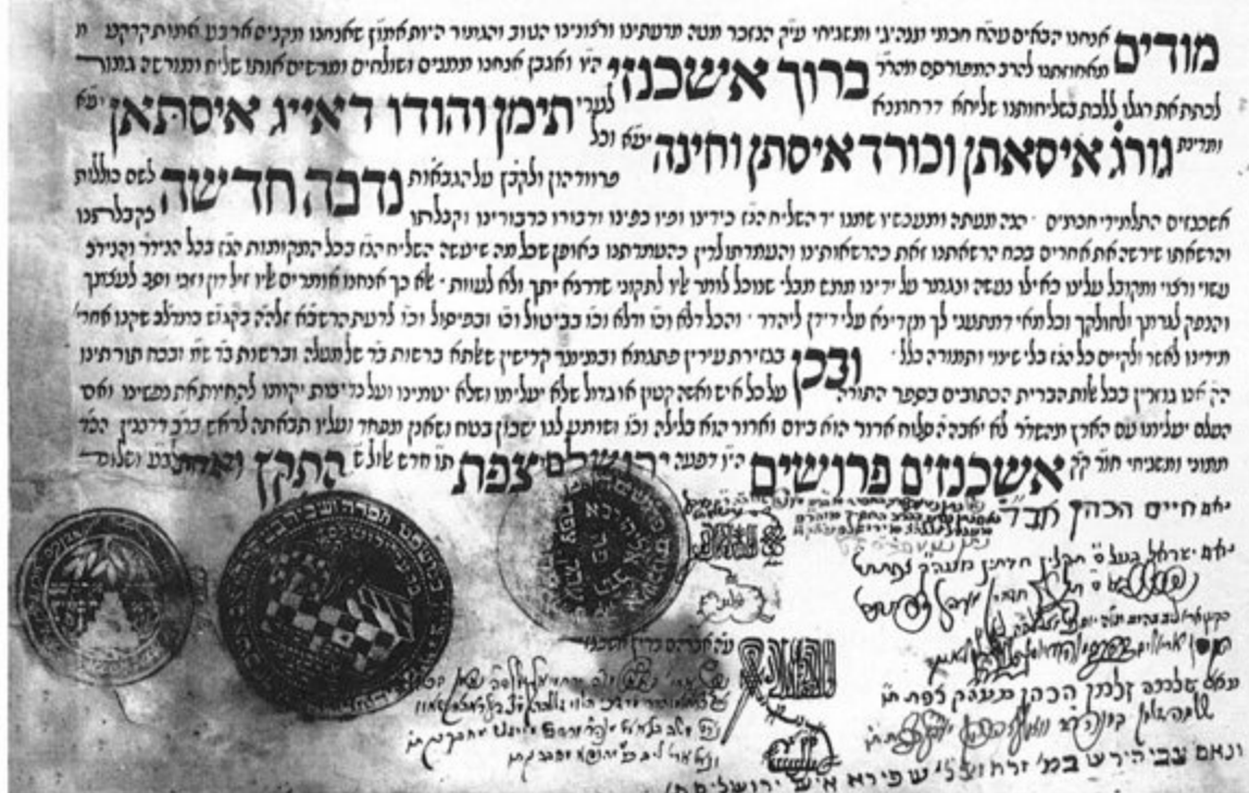
הדף האחרון בכתב השליחות של ברוך מפנסק אל עשרת השבטים בשנת תקצ"א (1830).