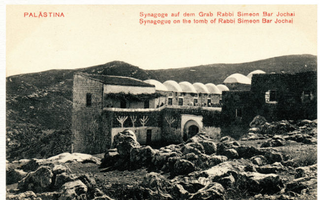
בתמונה שמלפני כ-90 שנה ניתן לראות בבירור שפתח החצר הוא ליד קברו של רבי יצחק נפחא

בתוכה, התברר שהיא פונה בחלקה לכיוון כביש הכניסה לציין הרשב"י. יש לציין שבשרטוט שנרשם לפני כ-126 שנה ומייחסים אותה למערה זו, נראים בה 13 כוכים, כך שמדובר במערה גדולה במיוחד.