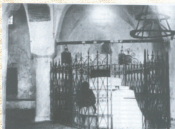
היכל רבי אלעזר - לפני הרחבתו