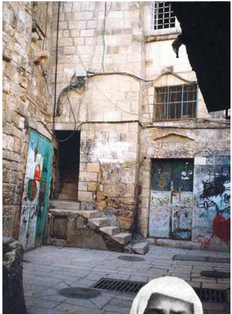
חצר הירשנזון, שבמרכזה בור מים וסביבה בחי מגורים אחדים, הייתה חצר יהודית טיפוסית בעיר העתיקה. המדרגות המוליכות למקום שבו הייתה החצר בעיר העתיקה של היום