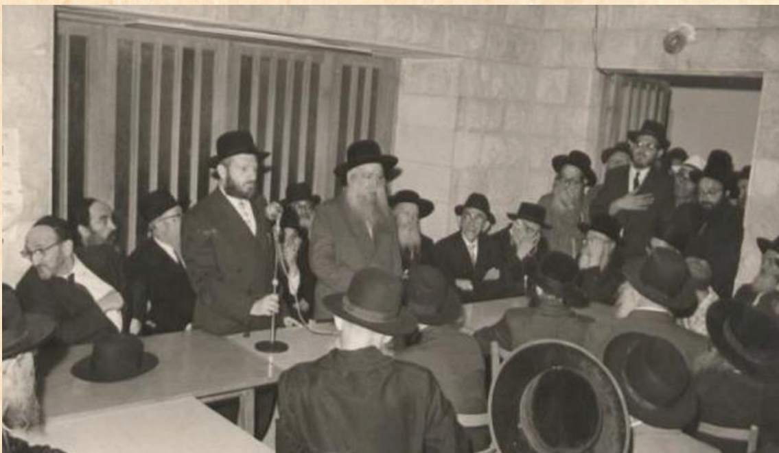
מזמור שיר חנוכת הבית. שמחת חנוכת הבית באמשינוב

מרכז החיים של חצר קדשו היה השולחנות הטהורים בלי"י שב"ק שהיו בבחינת קודש קדשים חוק ולא יעבור ואפ' בימים ההם שלא היה ה'עולם' גדול כ"כ היה מקפיד מאד לערוך טיש. בשנים קדמוניות היו בחורי ישיבת 'קול תורה' שבשכונה עולים ובאים לשולחנות הטהורים בלי"י שבת קור' דש ומתחממים לאור הגדול של מרן זי"ע ולימים הרבה מהם