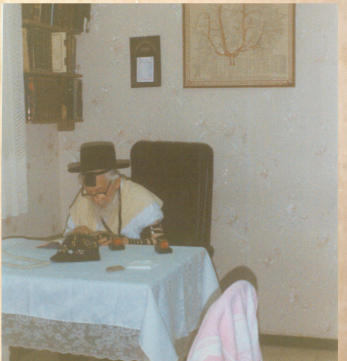
לפני ולפנים. כ"ק מרן אדמו"ר מטאלנא זצוק"ל בחדרו

עמנו בדור האחרון והשפיע מהוד זיו קדושתו על כל מכיריו קדושה וטהרה ואף פעל ישועות לרוב. אין די ביריעה מצומצמת זו בכדי להכיל את שגב פעליו הרבים של הרבי זצוק"ל, אשר ספרים רבים מלאים מהם אך פטור בלא כלום אי אפשר. הרבי אשר עשה את ימי ילדותו על אדמת ארה"ב, עלה לארץ הקודש בשנות בחרותו שם ספג וקיבל את דרך הלימוד אצל רבותיו אשר מצאו בו כלי מחזיק ברכה והסמיכוהו להוראה. לאחר נישואיו הקים הרבי את בית מדרש בשם "קהל חסידים - קהלת דוד" שבמונטריאול. באותם שנים – שנות השואה לא נח ולא שקט בכדי לעזור ולסייע ליהודים להנצל מעמק הבכא ולהיקלט בארה"ב.