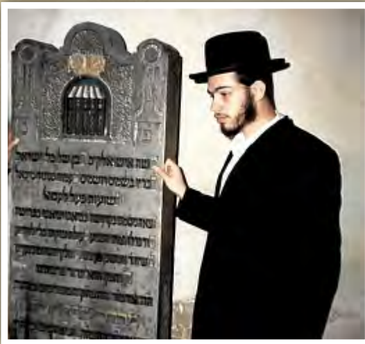
כ"ק מרן אדמו"ר שליט"א בבחרותו בתפילה על הציון הקדוש

משה איש אלקים, רבן של כל ישראל דבריו בשמים רושמים, כעמוד סגור מיכאל ישועות פעל לעם אל. יצאה נשמתו בקדושה, וכביאתו יציאתו בפרישה סוד גדלו תמיד הצניע, פעולת צדקתו בלי להודיע משיח ד' נתמשכן בעונינו, שימליץ יושר וטוב בעדינו הרחמן הוא יגדור פרצותינו ה"ה אדמו"ר ההצה"ק המפורסים מוה"ר מרדכי יוסף משה בן אדמו"ר ההצה"ק המפורסים מוה"ר יואל זצל"ה מסאליצא נפטר ביום י"א סיון תרפ"ט