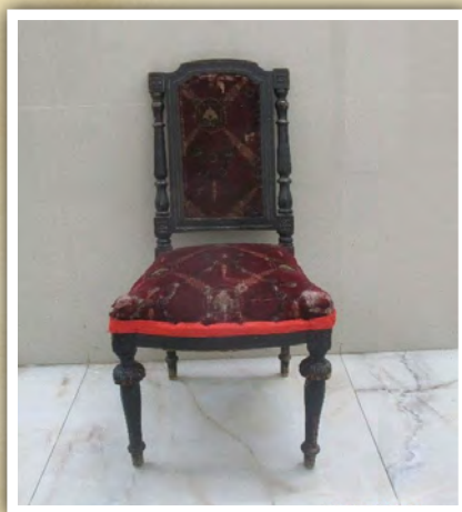
ריפוד הכסא של רבינו. משמש כהיום לכסא של אליהו בבריתות הנערכים אצל כ"ק מרן אדמו"ר שליט"א

עיני רבינו - צופיות היו למרחוק, וכל נעלם לא נסתר מנגד עיניו. עובדה הוי באיש יהודי שבא לפני רבינו עם בנו הבחור ודמעתם על לחיים, היות והבן הגיע לגיל הגיוס לצבא כשמשמעות הדבר הוא שגזירת שמד ר"ל מרחפת על ראשו, ובאו לבקש מרבינו שיעורר עליהם רחמים, אולם רבינו כמו מתעלם מבקשתם ועושה עצמו כאינו שומע. מובן שצערם ובכיים גברו עד מאוד, והאב בוכה ומתחנן: ברכנו נא רבי קדוש! לא יכל רבינו להתאפק יותר ואמר: הכיצד אוכל לברכו, אם אמו לא ברכתו?! סתם ולא פירש... הלכו ובדקו אחר הנער ואמו ומצאו בהם שמץ פסול. עט