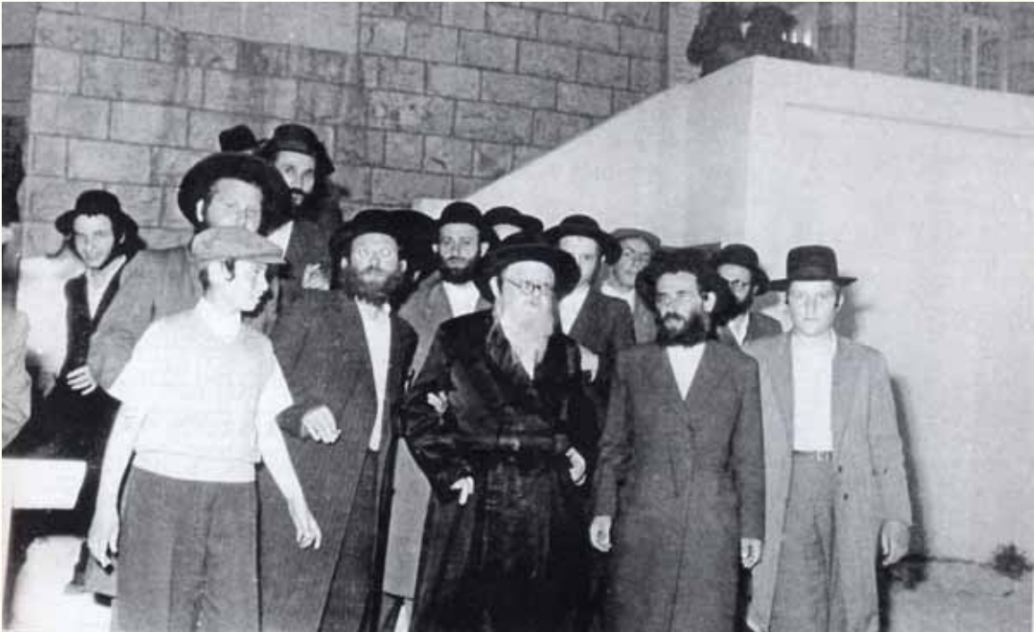
כל כולו וכל מהותו היה הישיבה. רבינו לצדו של חותנו מרן גאב"ד טשעבין זי"ע

הגר"י שליט"א מרחיב על כך, שלאור הערצה זו ששררה סביבותיו של רבנו זצוק"ל, הרי די היה בהערה בודדת ועדינה - כשנצרך, שהתלוותה תמיד בחיוך רחמאי וכובש, להעמיד בחור על מקומו.