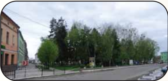
רחוב בעיירה הורודוק

ברוב ימות השנה נדד הרה"ק ה'בית אברהם' מסלוצק זי"ע בערים ובעירות ברחבי פולין כשהוא מזכה ומעורר את יהודי הגולה