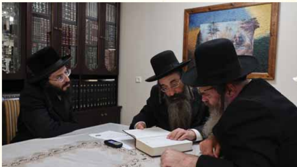
דער ראש הישיבה, ברב השיח המיוחד.

אך נדמה, שאף הן – כותלי הישיבה וריהוטיה, מנסות להשלים את שליחותן הנאמנת של מי שייחדן לשמש את לומדי התורה, וכך הן עומדות דוממות ושקטות – חסרי רצון להעיד על מה שראו – מי הוא האיש אשר הפיח רוח חיים בנשימות אפה של הישיבה, מי הוא אותו זקן שהמשיך במסירות עילאית את מורשתו הגדולה של חמיו – מרון שר התורה גאון