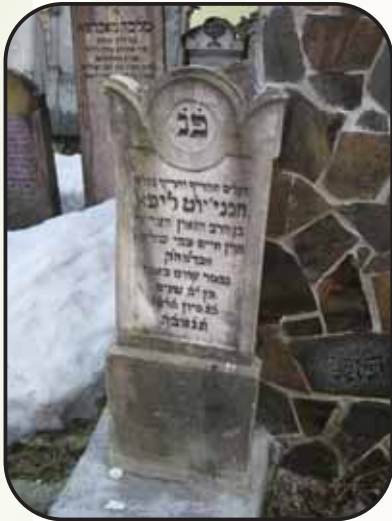
המצבה ליד אוהל צדיקי סיגעט