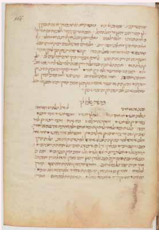
תחילת פרשת שלח מפירוש התורה לראב"ע. כ"י פריז 175

הרמב"ן מתייחס לקושי הזה ומבאר אותו: וכי תשגו ולא תעשו את כל המצוות האלה - הפרשה הזו סתומה במשמעה, ויטעו בה בעלי הפשט לומר שהוא קרבן על מי שלא עשה מה שצונו לעשות והוא שוגג.