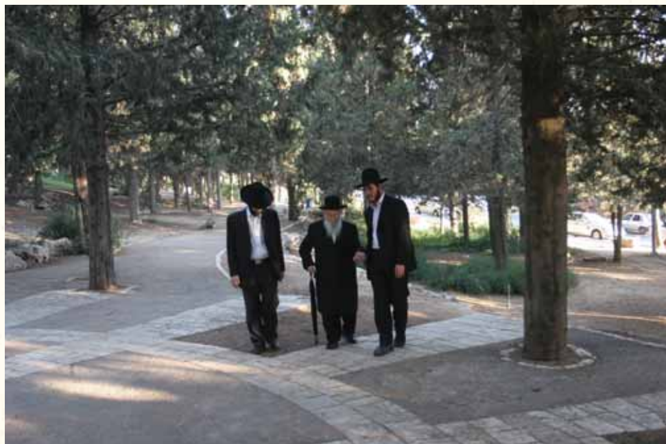
בהליכה לצרכי בריאות בהיותו בירושלים בבין הזמנים

יום ראשון בחדר השיעורים. רבינו בוחן את תלמידיו על תלמודם שלמדו במשך השבוע העבר. רבינו עובר אחד אחד, בחכמה ותבונה שואל כל תלמיד לפי רמתו, כדי שיצא מרוצה ויחוש שהוא יודע.