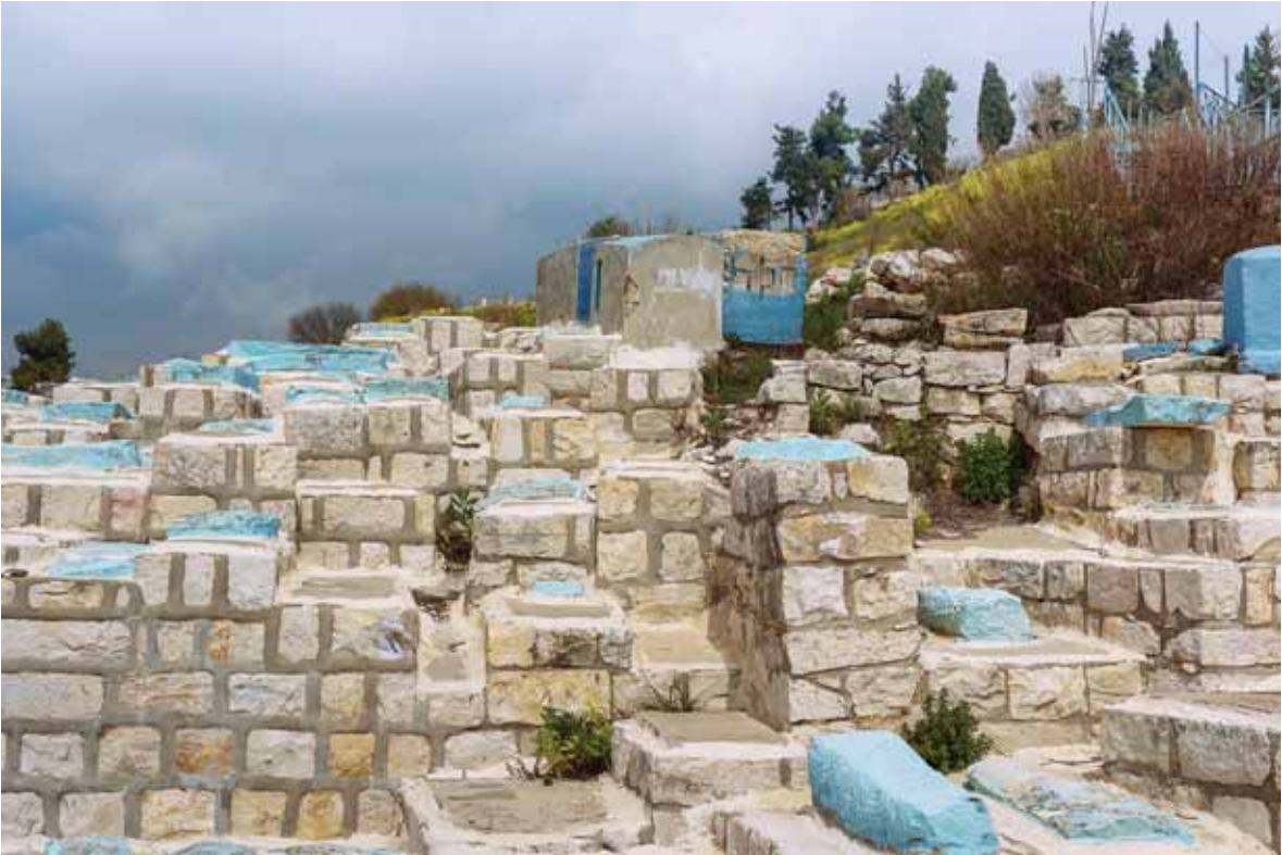
היתכן שצפת עדיפה מירושלים? בית החיים העתיק בצפת.