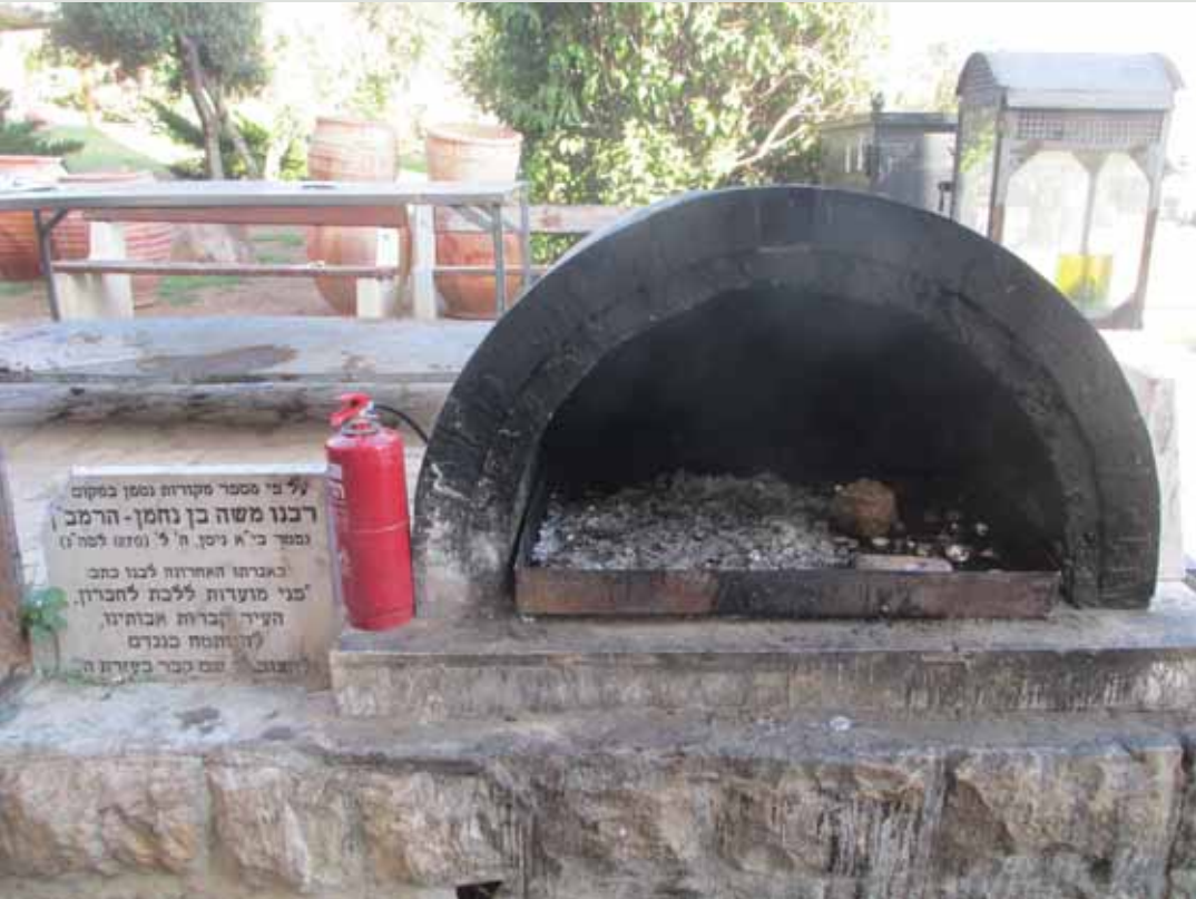
ציון הרמב"ן בחברון.

עם זאת, ידוע שמציינים את קברו של הרמב"ן בחברון,