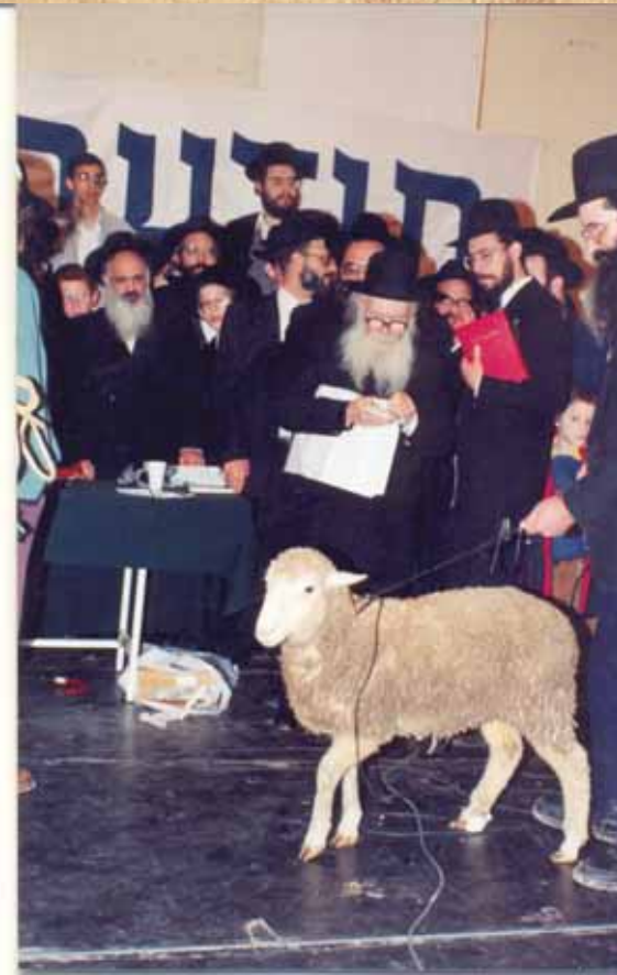
במצות פדיון פטר חמור

לאחר מכן כיבדנו בכוס מים ונפרד מאתנו לשלום. עד היום עומדת לנגד עיני התמונה הנפלאה הזאת, איך שרבינו יושב ולומד באישון ליל לאורה של מנורת הנפט בצריפו הדל, רחוק ומנותק מכל הוויית עולם הזה, ואין לו בעולמו אלא לימוד התורה הקדושה. אלו דברים שצריכים להישאר ללימוד לדורות הבאים.