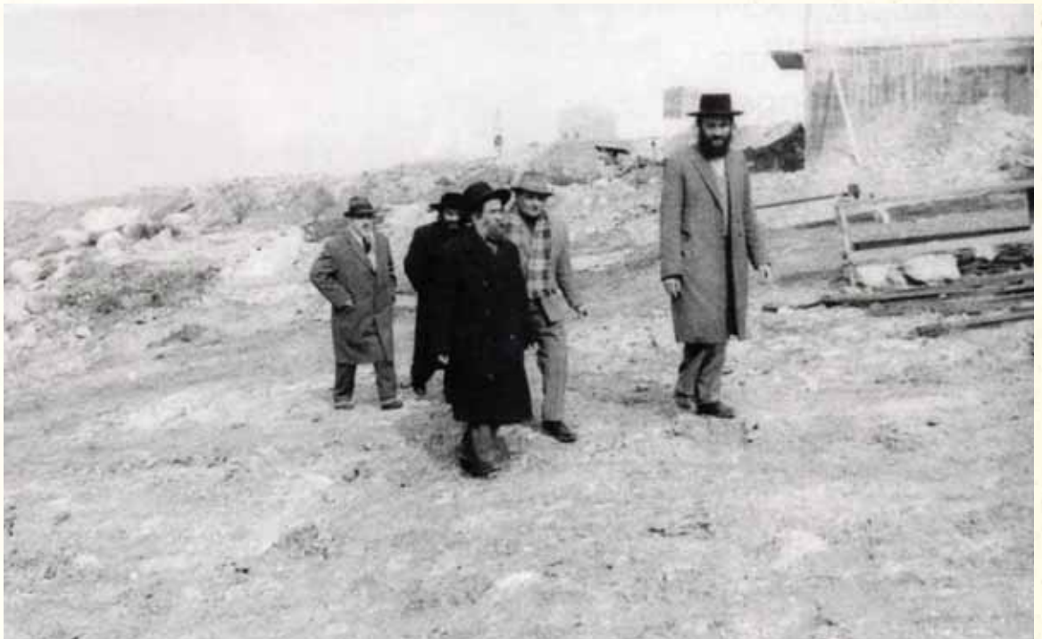
לענוים יתן חן. מרן ראש הישיבה בשטח שעליו נבנתה הישיבה