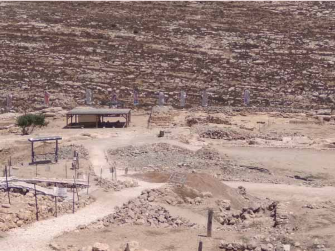
מקום המשכן בשילה

לפי דרכו של ראב"ע מתיישבת נקודה נוספת תמוהה מאוד.