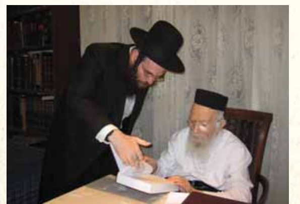
סופר המבשר אצל רבינו

הדבר היחיד המוטל עלינו הוא לצעוד בעקבות הרועים - רבותינו זיע"א, שהעמידו את דור בני התורה ועולם החסידות לאחר השואה האיומה, וכל עבודתם היתה לבנות מסגרות של