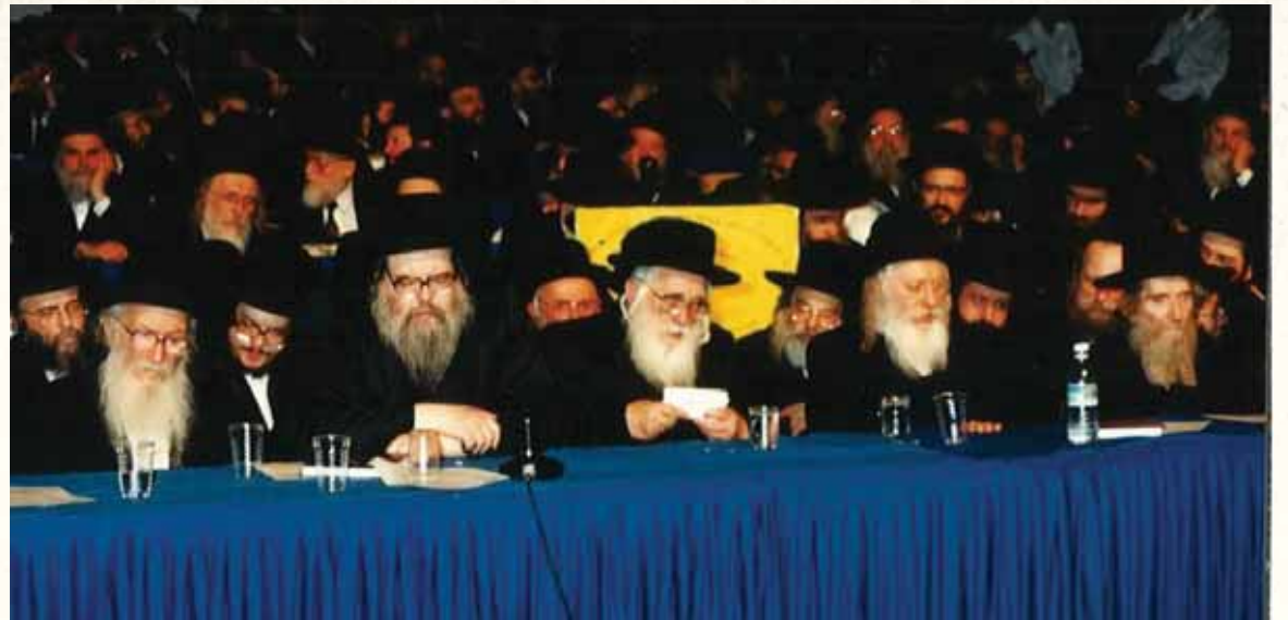
בסיום הש"ס ביד אליהו

צעדנו שלושה בחורים במשעולי בני ברק החשוכים. עלינו בהר, חצינו את הפרדס, והגענו אל ביתו - 'הצריף' שבמעלה הרחוב. הבית כולו היה חשוך, ניסינו להטות את אוזנינו ולא שמענו מאומה, ובאכזבת מה, החלטנו לסוב על עקבותינו. אך קודם לכן הקפנו את הצריף, ואז הבחנו