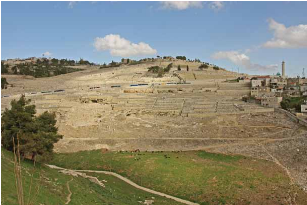
ירושלים עדיפה. הר הזיתים