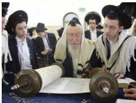
ראש הישיבה בקריאת התורה

שמעתי מאיש זקן שהיה מקורב אצל הרוגאצ'ובר זצ"ל, ופעם הוא שאל אותו כמה זמן לוקח לשכוח מה שלמד, והוא ענה לו תיכף כשאני סוגר את הדף, [וזה פסוק מפורש "התעייף עיניך בו ואיננו"]. ולא בבת אחת זה נשכח לאט לאט, כמו במקוה ש'חסר ואתאי', וגם בשוחט שאינו יודע שחיסה זה 'חסר ואתאי' שזה לא נעשה בבת אחת, וכן בלימוד התורה אם לא חוזרים שוכחים ואם לומד תורתו משתמרת במקום אחר, שע"ז נאמרה בתורה האזהרה "פן יסורו מלבבך כל ימי חייך".