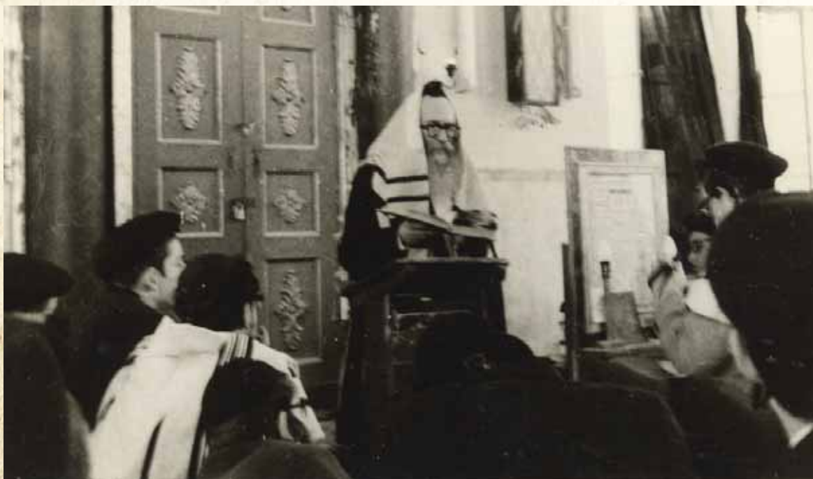
כל מילה בתכלית הנקיות. רבינו מוסר שיעור

הרי לנו מכאן יש לנו לימוד גדול גם על כך, כמה גדול כח ההורים בתפילותיהם ודמעותיהם להצלחת בניהם.