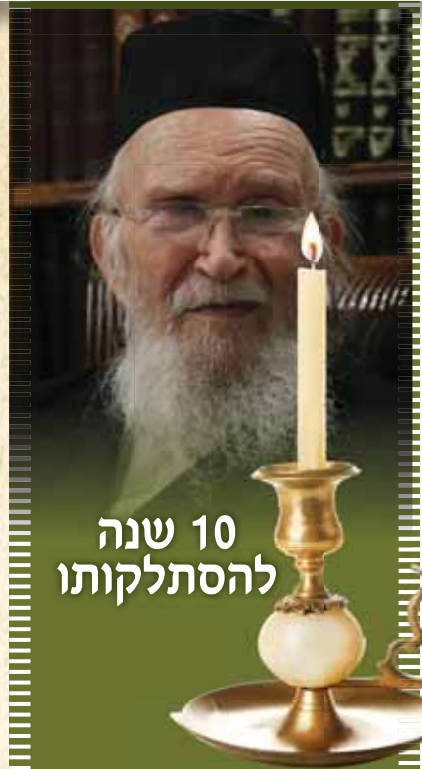
10 שנה להסתלקותו

היה מעשה אצל החזו"א זצ"ל, שהגיע אליו יהודי בעה"ב חשוב, שחלם חלום עגום, והיה מודאג מזה. החזו"א שאל אותו לשמו ולשם אמו, וכל יום לאחר פת שחרית - כנראה, היה החזו"א מגיע לביתו לבקר אותו ולדבר עמו, עד שיום אחד בא אליו ואמר לו עכשיו אני