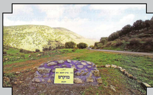
ציון מוקרט בגמר בנייתו לפני כמה שנים. כיום נחרב ע"י אלמונים וניכרים רק אבנים בצבע כחול