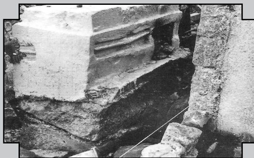
המצבה הישנה על גבי הארון העתיק שנחשף בשנת תשל"ט התמונה מתוך ספר מקומות קדושים וקברי צדיקים בגליל