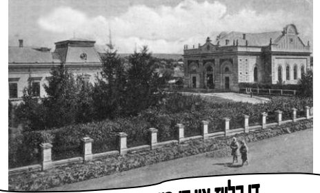
די קלויז און די הויף אין באיאן