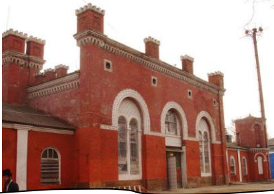
די קלויז אין סאדיגורא