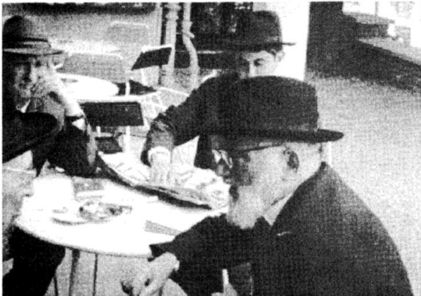
יחד נאמן, מוסף שבת קודש

רבי אליהו ברוך הוסיף ביחס למעשה זה: אף שרבי איסר זלמן בוודאי היה ראוי, אני לא הייתי עושה את זה, אמר ר'