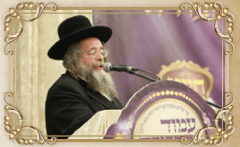
הרה"ח ר' יצחק דוד אלטר שליט"א