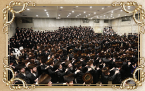
ליהודים הייתה אורה - אורה זו תורה