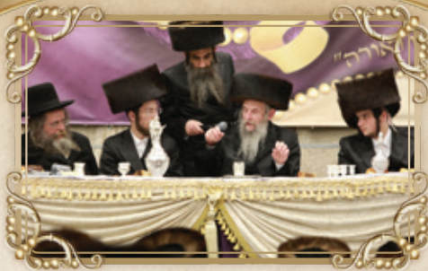
בכח הרבים... גיבין אלע אוועק זייער רצונות און פונדעם ווערט א מטבע של אש