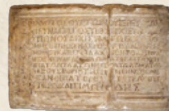
הכתובת היוונית שהוצבה בחזית אחד מבתי הכנסת בירושלים בזמן המקדש