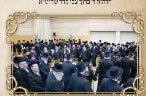
כי הם חיינו...