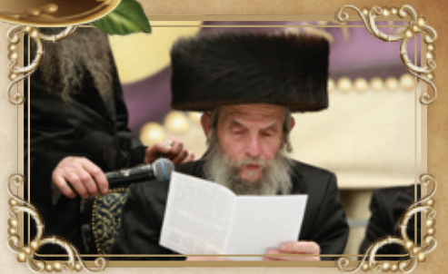
לא נתנשי מין לא בעלמא הדין