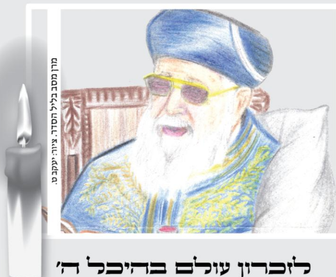
מֶרֶן מִסֵּב בְּלִיל הַסֵּדֶר. צִיּוּר: יַעֲקֹב ט.