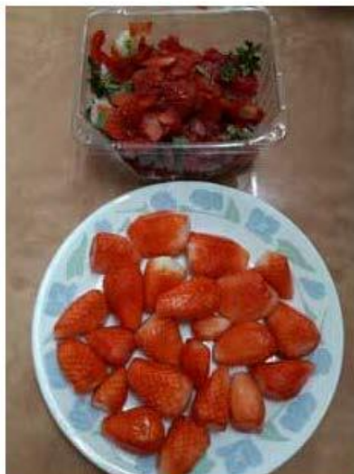
תות שדה לאחר קילוף השכבה החיצונית כולל הגומות

ערכנו בדיקות רבות באזנים שונים ועמל רב, לעילות השטיפות להסרת חרקים בתות שדה - זנחנו כי השטיפות כפי מה שהיה מקובל אין יעילות מספיק, ועלולים להישאר חרקים בודדים.