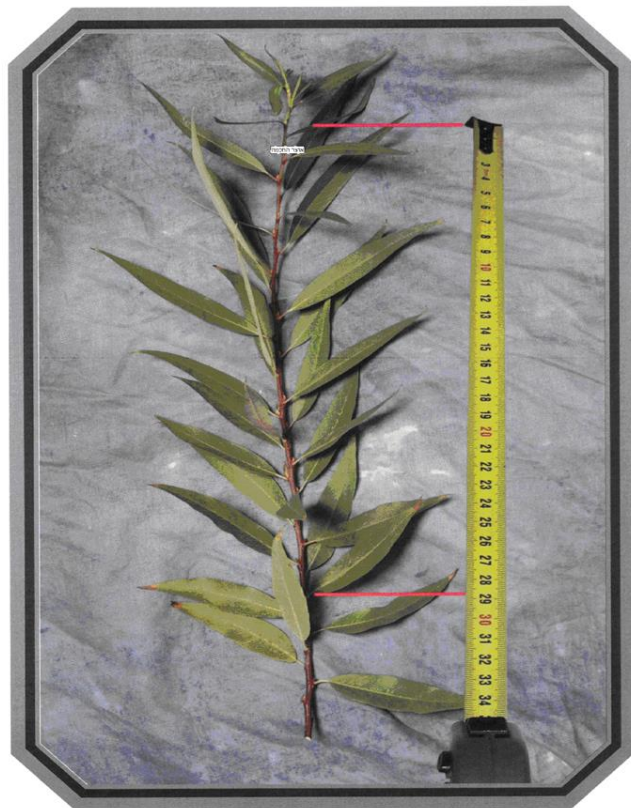
שיעור הערבה ג' טפחים

עמוד מס 245 ארבעת המינים למהדרין (צבעוני) עדס, אברהם חיים בן דניאל הודפס ע"י תכנת אוצר החכמה