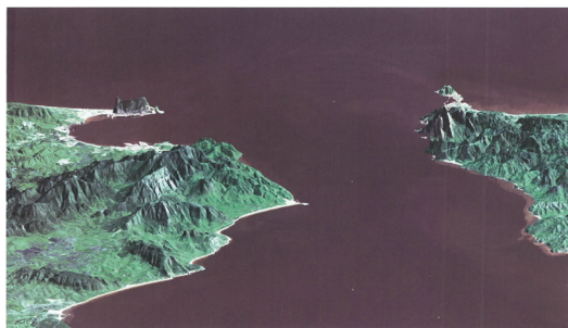
סינר גיבולדס - סינר המזכיר את הים התיכון עם האוקיינוס האטלנטי. בתמונה מראה מחזור של הסינר בתצפית מזרחית מים התיכון, מציג סינר גיבולדס ומבולת העליון האוקיינוס האטלנטי

אמנם בשולחן ערוך (סימן רכח סעיף א) כתב על ימים ונהרות, הרים וגבעות ומדברות, אומר: