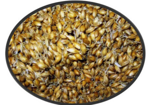
גרעין תבואה (לרוב שעורה) שסופג לחות ומתחיל בתהליך הגבשה

שלא רשום על התווית דבר שיכול להעיד על יישון בחביות יין, שהרי רוב החביות של הויסקי הסקוטי הם של וויסקי 'בורבון' אמריקאי, ואין בו בליעות יין נסך. וא"כ בסוג ויסקי שמורכב מכמה סוגי אלכוהול, שחלק מהם היו בחביות של יין, מה שנקרא 'ויסקי בלנדד' [כדוגמת ג'וני ווקר ושיבס ריגל שמעורב בהם עשרות סוגים של וויסקי בכל בקבוק]. אך כיון שרק חלק מהמשקה יש בו בליעה של יין, עדיין יש ביטול בשישים כנגד היין שבכל המשקה.