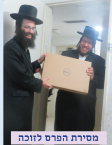
מסירת הפרס לזוכה

בצל 'משבר הקורונה', התקיים במתכונת מצומצמת מעמד ההגרלה הגדול, על פרסים יקרי ערך, בין התורמים החשובים, הזוכים בכרטיס טיסה לליז'נסק, ובשבת במירון יקבלו את הכסף במזומן!