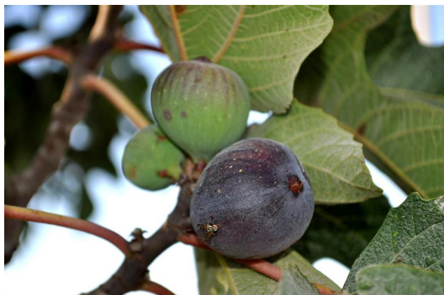
תאנה בשלה ועליה זבוב שהגיע לטעום מן המתוק המתוק

ייתכן והסבר זה, המדגיש את עדיפותו של הצד המזרחי של העץ דווקא בחלקו הראשון של היום, עשוי להוות תשובה לשאלות הרש"ש: "למזרחה של תאנה. ופירש רש"י שהשמש מכה וכו'. וק"ל דא"כ למערבה נמי דמכה השמש שם מחצות עד הערב. ותו ק"ל דלדרומה עדיפא טפי דשם השמש מכה ברובה של יום ובמנחות (פה) איתא מן השדות המודרמות. ואולי י"ל מפני שהרוחות המנשבות מב' צדדים אלו (רצוני מערבית ודרומית) קשים כדאיתא בב"ב (כה) ע"ש היטב מפסידים מגד הפירות". אם אכן המעשה של רבי יוחנן התרחש בשעות היום המוקדמות הרי שהמזרח הוא הצד שקיבל את מנת הקרינה הגדולה ביותר.