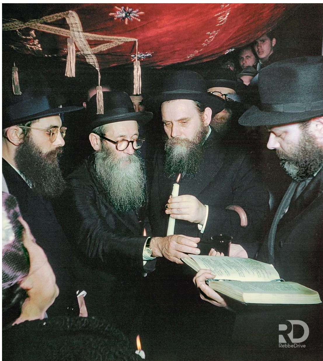
תש"ד. הרבי מסדר קידושין בחתונת הרב ר' יואל