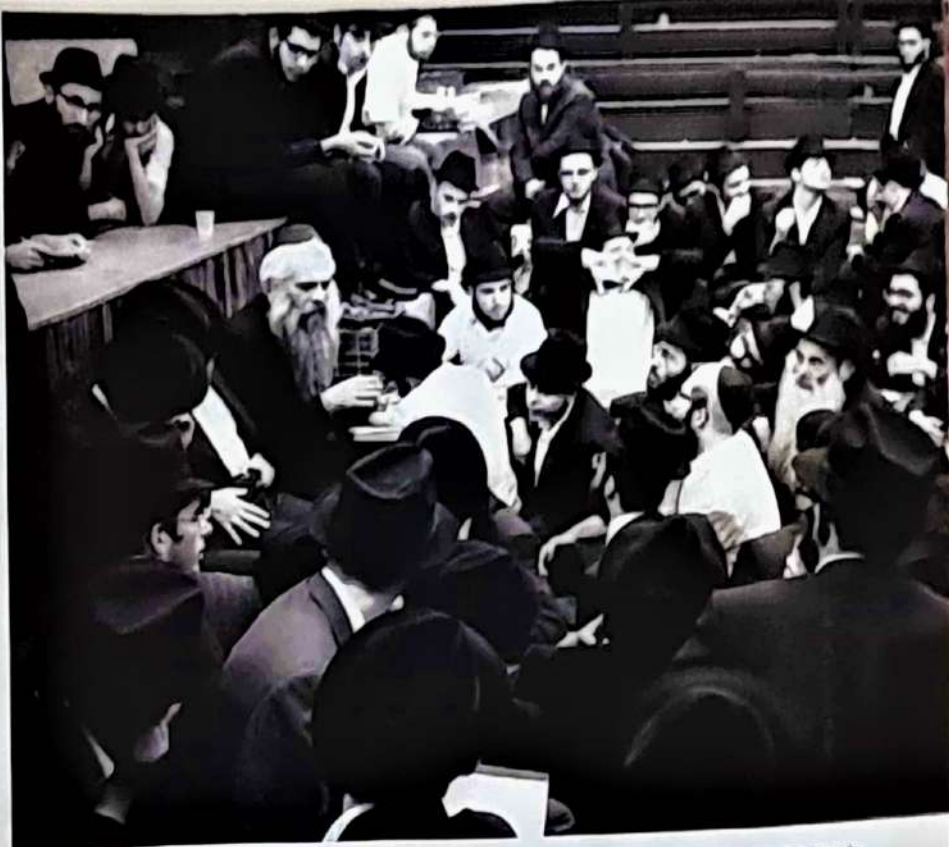
ה'חזור' בחזרה' בגני קהל התמימים ואג"ס ב'770 לאחר התוועדות עם הרבי