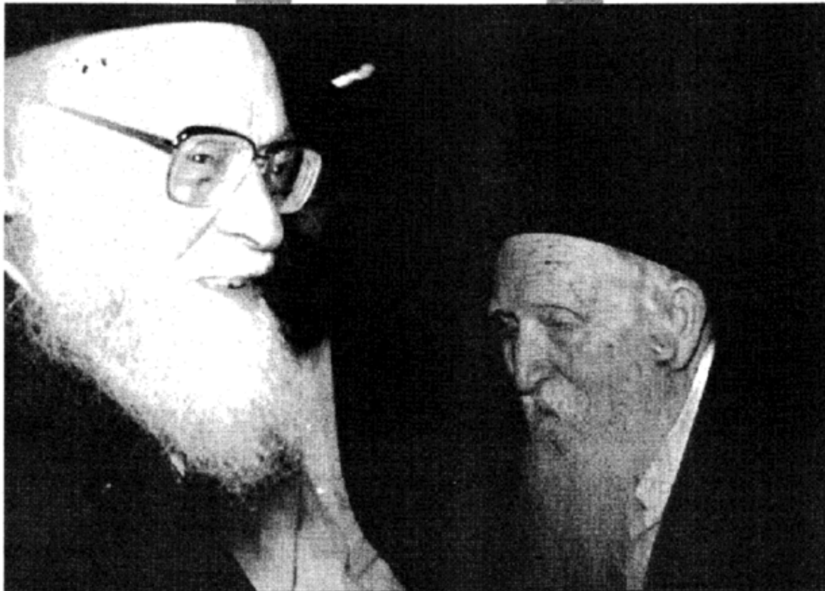
עם יבדלחט"א מרן הגר"ש אלישיב שליט"א

מקרבם ומחבבם, מעודדם ומתעניין בשלומם. בתקופות מסוימות אף היה מקבץ סביבו קבוצות נערים, שעמם היה לומד מידי יום. סיפר הגר"י רוזן שליט"א - ראש ישיבת אור ישראל, שנמנה בזמנו עם אחת מקבוצות אלה: "יותר ממה