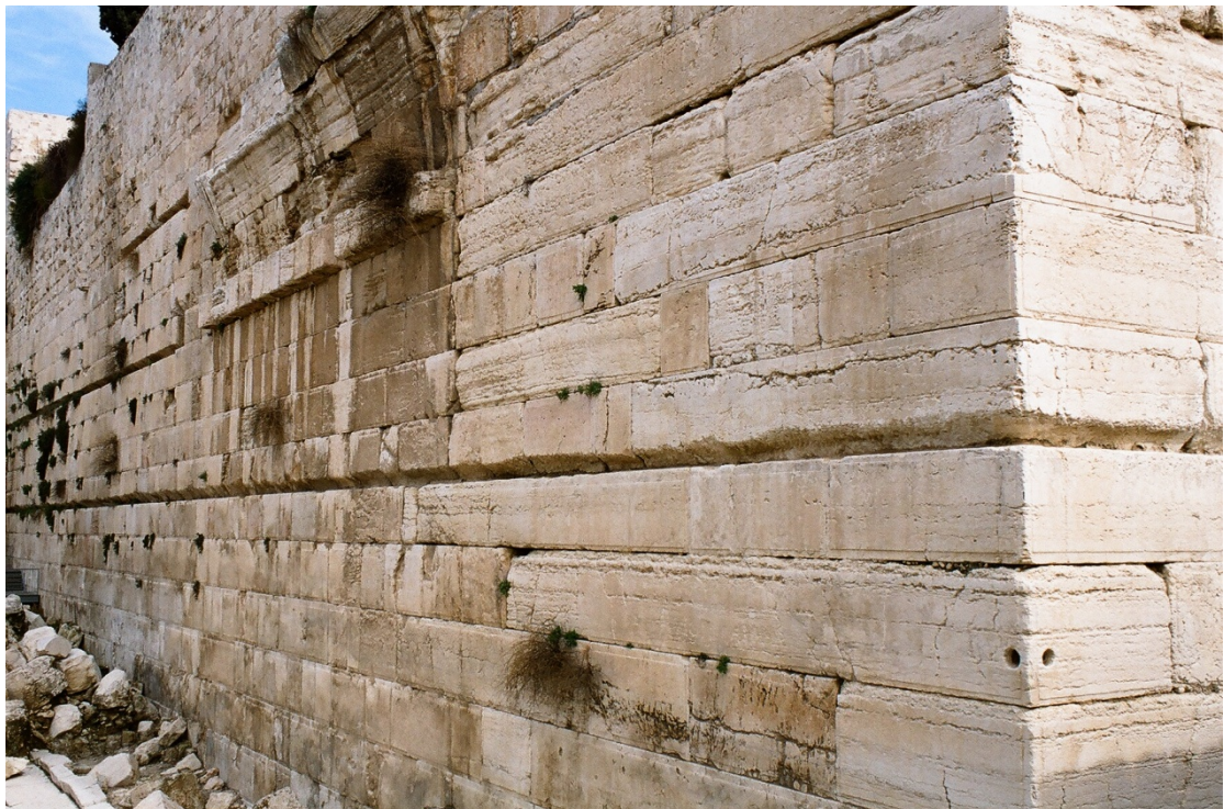
קֶרֶן דְּרוּמִית מִעֶרְבִית שֶׁל מִתְחַם הַר הַבַּיִת [הַדְּרוֹם הוּא בְּצֵד יְמִין], נִיתֵן לַהֲבַחֵין בְּשֵׁרִידֵי קֶשֶׁת רוֹבִינְסוֹן בְּכוֹתֵל הַמִּעֶרְבִי [הָאֲבָנִים הַבּוֹלְטוֹת מֵהַכוֹתֵל] שֶׁעַל גִּבּוֹ הִיטָה הַכְּנִיסָה הַדְּרוּמִית מִתּוֹךְ אַרְבַּעַת הַכְּנִיסוֹת שֶׁהָיוּ בְּכוֹתֵל הַמִּעֶרְבִי לְתוֹךְ מִתְחַם הַר הַבַּיִת (עִי' פֶּרֶק י"ד)