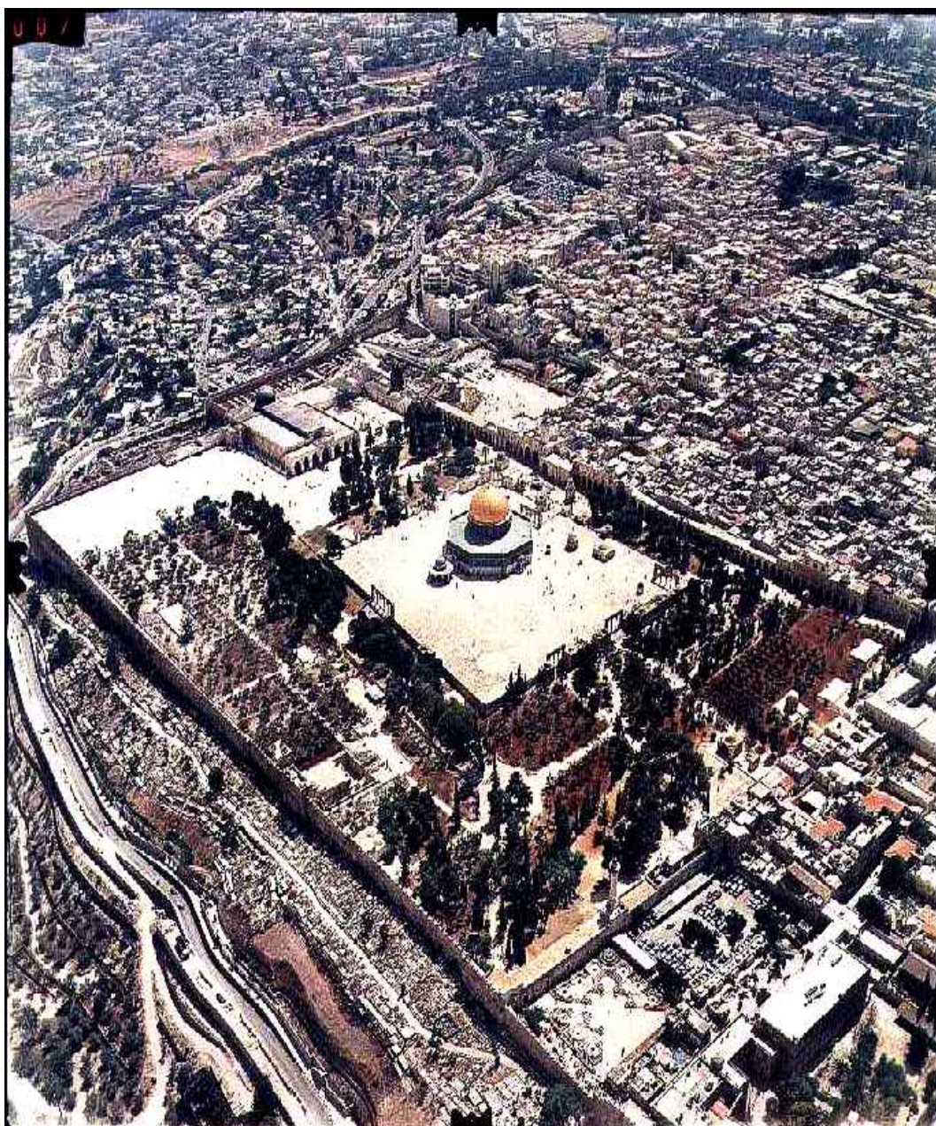
מבט על מתחם הר הבית מצד מזרחית צפונית, הכותל המזרחי ממשיך לתחום את העיר וכולו נראה ככותל אחד (עי' פרק י"ח)