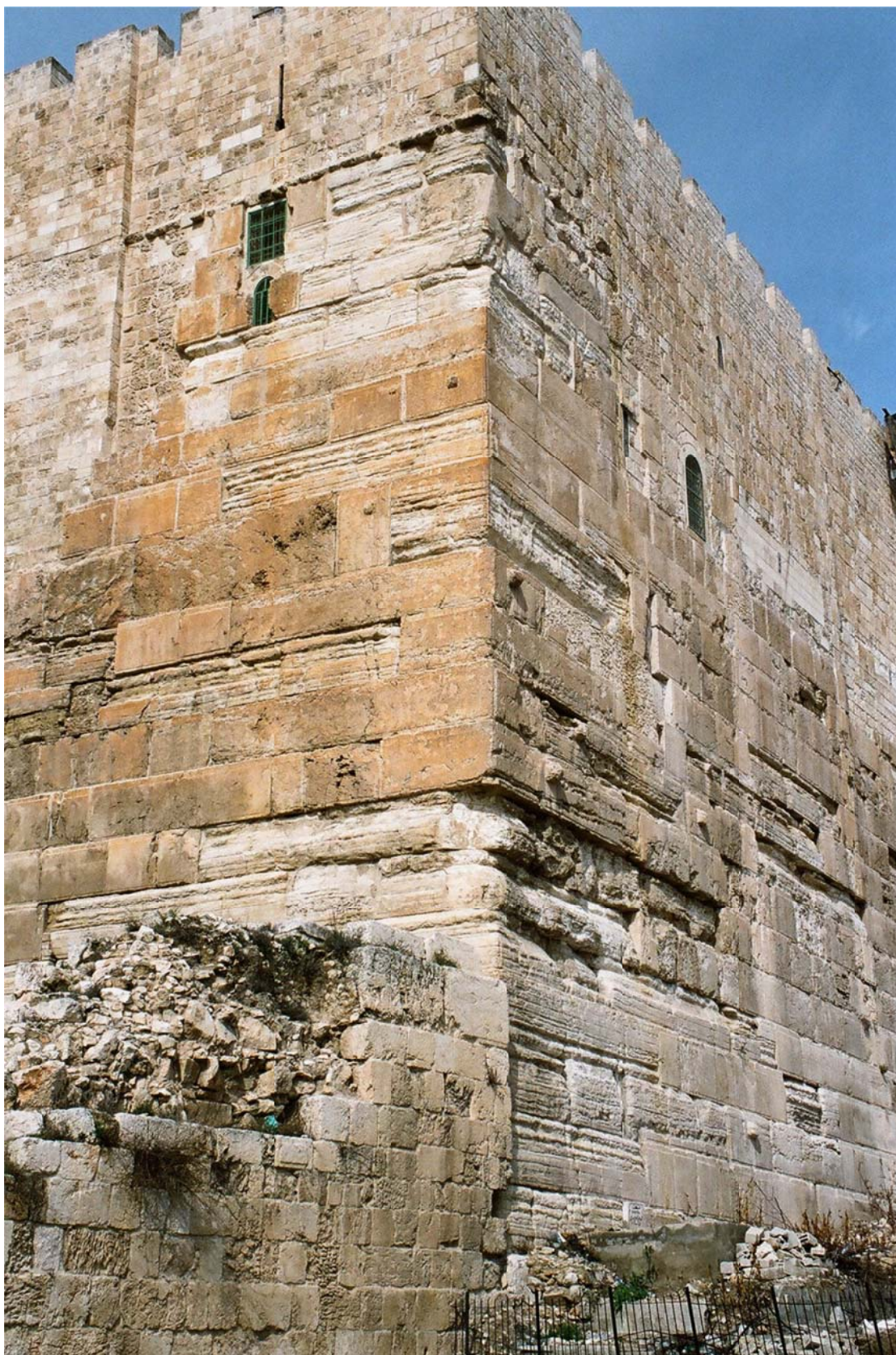
קרן מזרחית דרומית של מתחם הר הבית [הדרום הוא בצד שמאל]