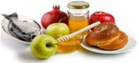
הרב יצחק יעקב פוקס