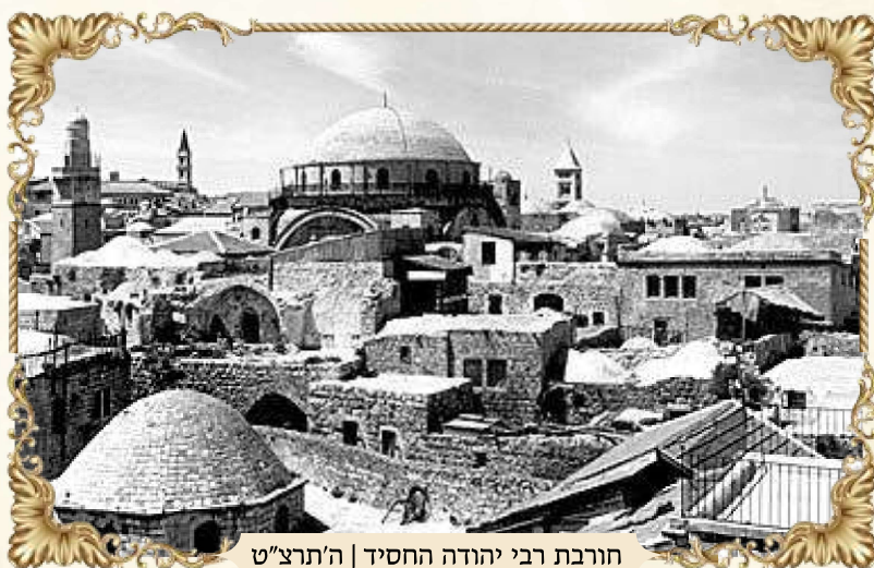
חורבת רבי יהודה החסיד | ה'תרצ"ט

שנמצא בקבר, ולא נשאר מעם ישראל כלום, רק עפר ורקב, ועתה מקווים לתחית המתים. מעתה, 'התנערי מעפר קומי' וכו', משמעו לצאת מהקבר של חוץ לארץ ולעלות לירושלים, ואז יערה עלינו רוח ממרום - כשיבנה בית המקדש בב"א - רוחנו ועטרת ראשנו כנ"ל.