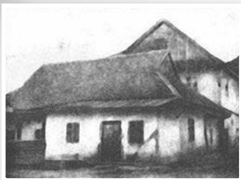
היכלא קדישא של אור שבעת הימים מרן הבעש"ט הק' זי"ע