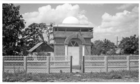
האהל הק' על ציון רביה"ק רבי פנחס קאריץ זי"ע בעיר שפיטיווקא

בער ממעזריטש זי"ע) און א קלוגע פנחס (רביה"ק מקאריץ זי"ע). ז