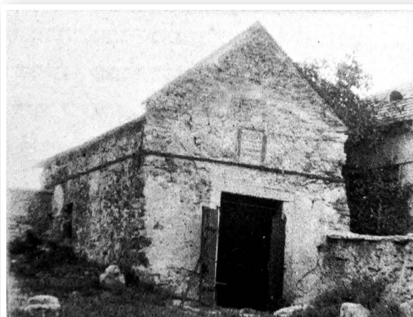
תמונה ישנה מהאהל על ציונו של הרה"ק בעל 'ישמח משה' זי"ע באוהעל