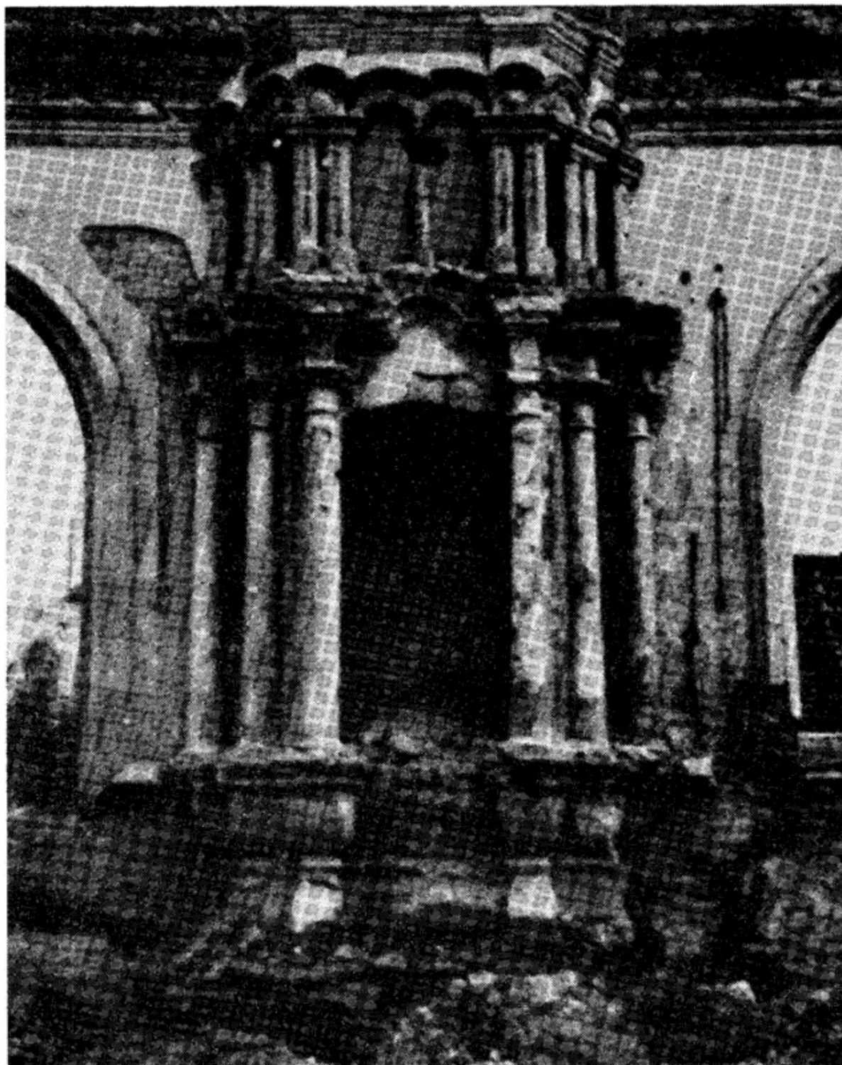
חורבות בית הכנסת בו התפלל הגאון מוילנא. פנים בית הכנסת (מצילומי יד ושם).

מחלקו בעולם הבא, השיב לשליח שאינו מוכן להפסיד אף משהו מחלקו בעולם האמת והוא מעדיף לעלות על המוקד ולקדש את ה'.