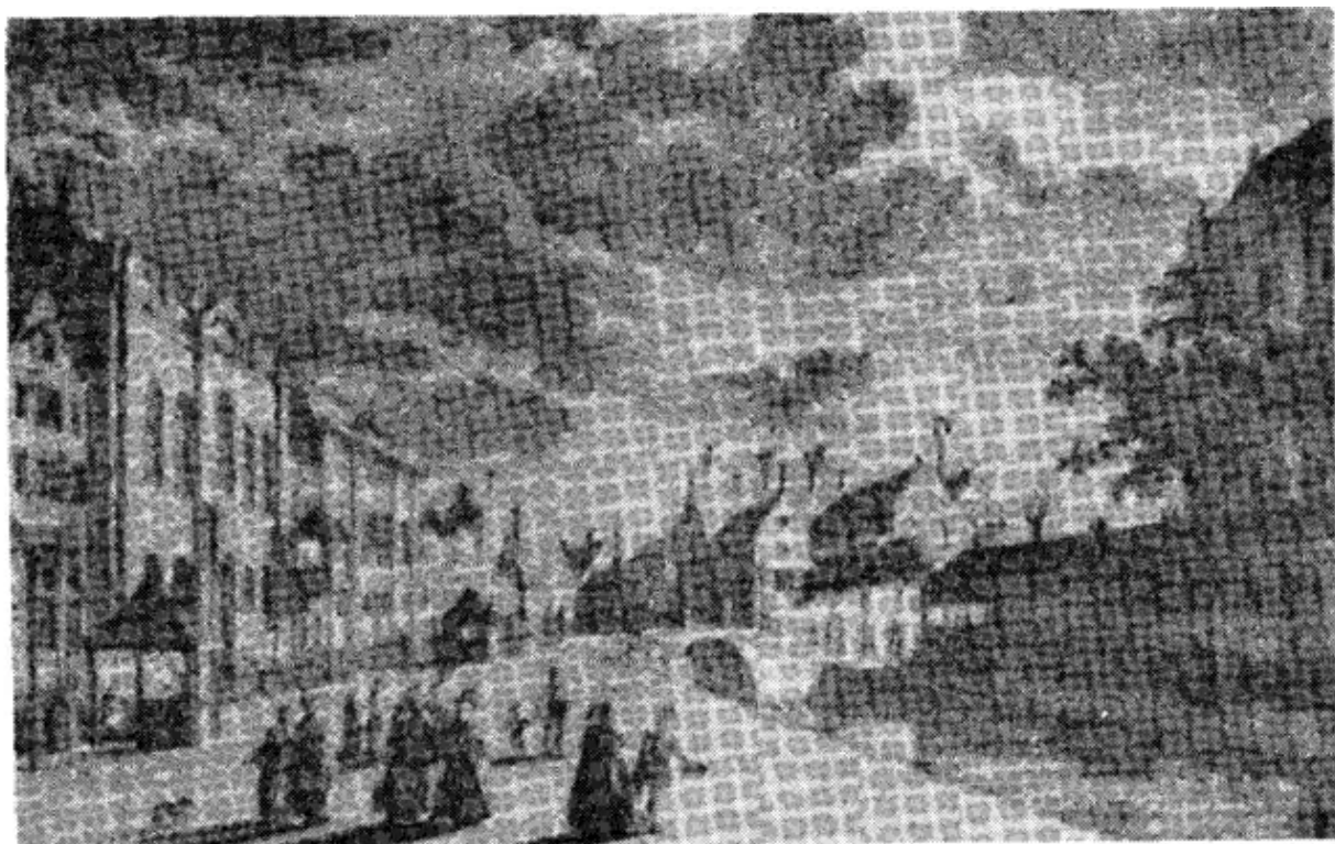
מראה הגטו היהודי באמסטרדם לפני מספר דורות.