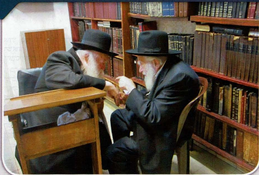
בסוד שיח עם יבלח"ט מרן שר התורה שליט"א