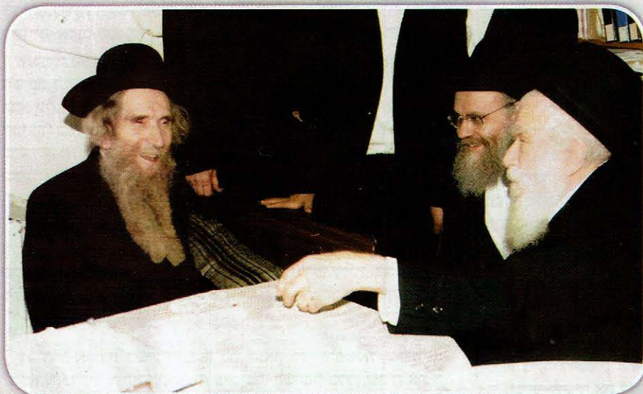
במעונו של רשכבה"ג מרן הגרא"ל שטינמן זצוק"ל