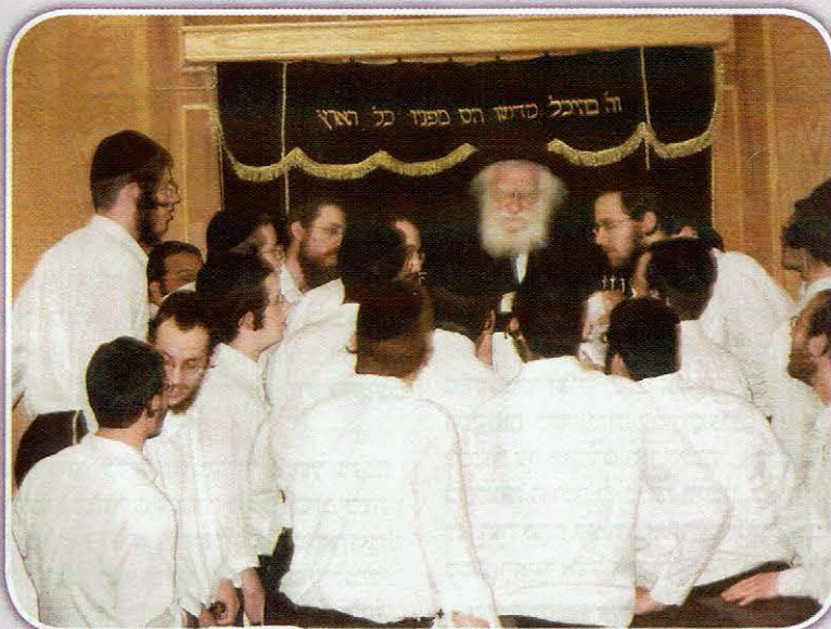
בשיח של תורה עם תלמידים לאחר שיעור כללי

מיד הוא הוציא גמרא שבת. באותו זמן מסר שיעורים על סוגיית