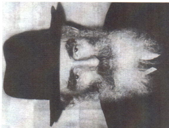
רבי יחזקאל לווינשטיין מנהל רוחני דיישיבת מיר