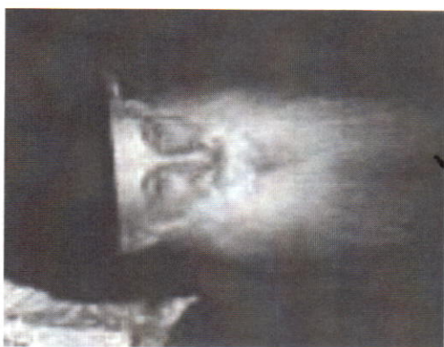
רבי אברהם קלמנוביץ ר"מ דיישיבת מיר בארה"ב