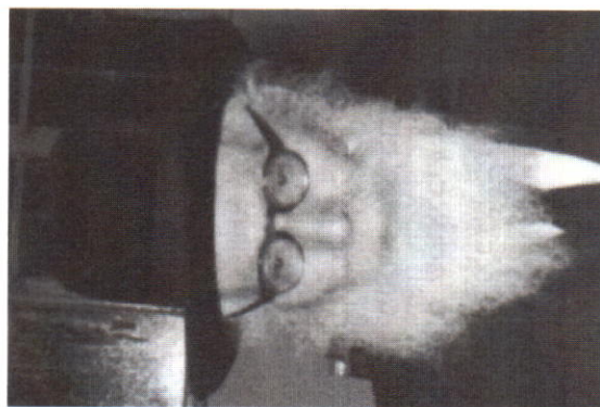
רבי אליעזר יהודה פינקל ראש ישיבת מיר