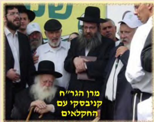
מרן הגר"ח קניבסקי עם החקלאים

וזה חידוש שעדיין לא שמענו באף ישוב אחר. בכל שנות השמיטה לא נשמע כדבר הזה.