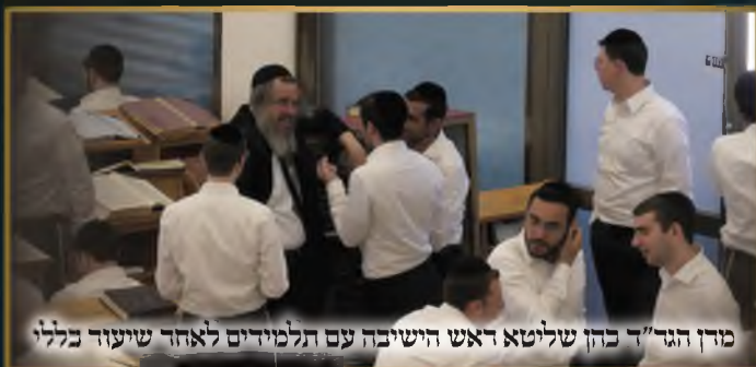
מרן הגר"ד בהן שליטא ראש הישיבה עם תלמידים לאחר שיעור כללי