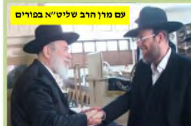
עם מרן הרב שליט"א במורים