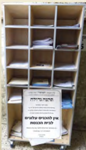
המתקן בכניסה לבית הכנסת, וברקע - צילום מתקנת הרב

לאחר שרבינו המרא דאתרא מרן הגר"י זילברשטיין אישר את התקנה, אכן לא מוכנסים העלונים אל תוך ההיכל. בכניסה הוצב מתקן מיוחד, שם ממתניים העלונים, ואפשר לקחתם בצורה מסודרת.