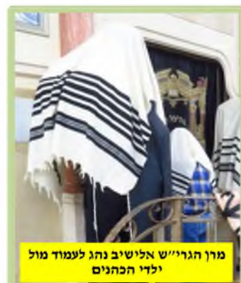
מרן הגר"ש אלישיב נהג לעמוד מול ילדי הכהנים

ולענין אחר. ת"ח ביקשו להעיר מדוע הכהנים אינם מחנכים את ילדיהם כבר מגיל קטן, לשאת ידיהם ולברך את העם. מדוע שונה מצוה זו מכל המצוות האחרות שבהן אנחנו מחנכים את