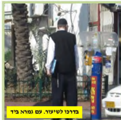
בדרכו לשיעור. עם גמרא ביד

גם החולים האחרים נדהמו ממסירותו וטוב-ליבו. אבא הודה