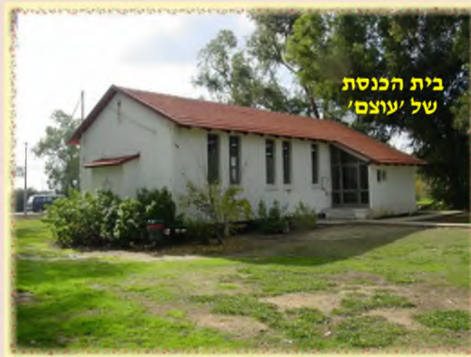
בית הכנסת של 'עוצם'

המושב החכירו את שדותיהם, והחוכרים החליטו על-דעתם לעבוד בשמיטה.