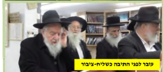
עובר לפני התיבה כשליח-ציבור