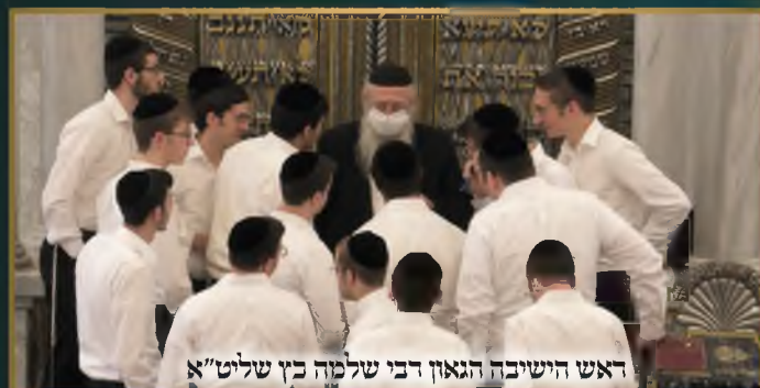
ראש הישיבה הגאון רבי שלמה כץ שליט"א