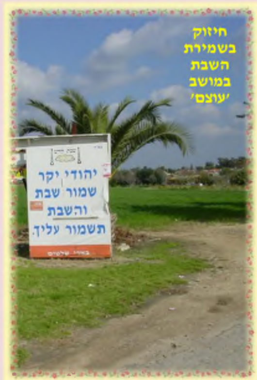
חיוק בשמיטת השבת במושב 'עוצם'

בנוסף לכך, בתוך המושב עצמו קיימים 3 כוללים גדולים, בשניים מהם לומדים עשרות אברכים המגיעים מאשדוד