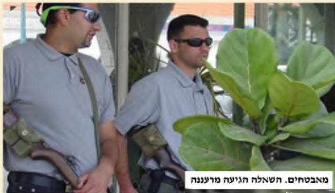
מאבטחים. השאלה הגיעה מרעננה

אני מתגורר בעיר רעננה, ולאחרונה - בשל הפיכת אחד השכנים למפורסם, ובעל אבטחה כבידה מאוד - כל מעבר באזור בו הוא מתגורר דורש בידוק קפדני מצד המאבטחים. כיון שאין לי בית כנסת ליד הבית, הנני זקוק לעבור דרך הרחוב המאובטח, שנהפך לשטח סטרילי לחלוטין, והמעבר דרכו מתאפשר רק לאחר הצגת תעודת-זהות. לאחר שהמאבטח מאפשר את המעבר, הוא מדווח על-כך בקשר למאבטחים האחרים המצויים במקום.