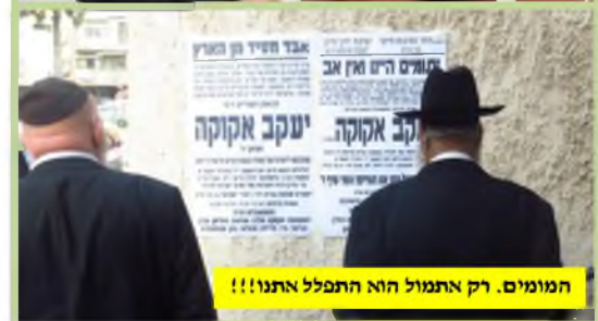
המומים. רק אתמול הוא התפלל אתנו!!!

זצ"ל, שבזמן חיותו כאן, אתנו, יכולנו ללמוד כיצד מנצלים את הזמן היקר שניתן לנו מן השמים, יכול עתה ללמדנו - גם בהיותו בגן-עדן - שבאמת לא יידע האדם את עתו, ואין מי שיכול לומר 'לי זה לא יקרה'. מי שראה אותו נכנס למנין הותיקין באותו יום ששי, כשהוא נמרץ וזריז, באמת שלא יכול היה להאמין למראה המודעות השחורות שנתלו על הלוח.