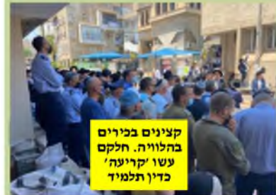
קצינים בכירים בהלוויה. חלקם עשו 'קריעה' כדין תלמיד