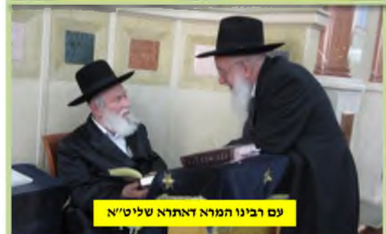
עם רבינו המרא דאתרא שליט"א