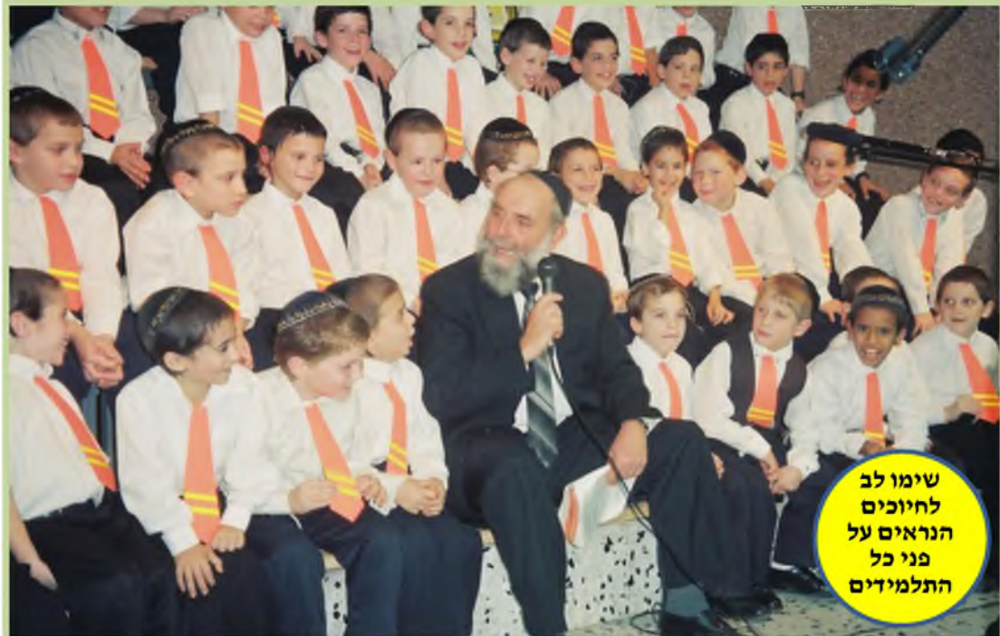
שימו לב לחיוכים הנראים על פני כל התלמידים

'ילדים חלשים' היו ממש ה'הובי' שלו, והוא חיבב את העיסוק איתם, וחזר ושינן יחד איתם את החומר שנלמד, בסבלנות אין קץ. כמו כן היתה לו גישה מיוחדת לילדים בעלי צרכים מיוחדים וחניכם מתוך סבלנות מופלאה למרות הקושי שהיה