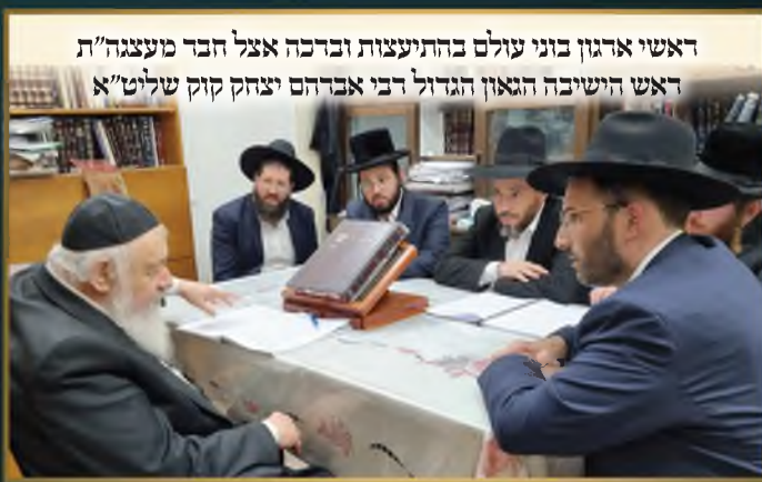
ראשי ארגון בוני עולם בחתיעצות וברכה אצל חבר מעצגה"ת ראש הישיבה הגאון הגדול דבי אברהם יצחק קוק שליט"א