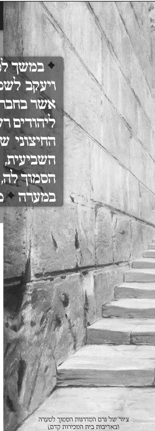
ציור של גרם המדרגות הסמוך למערה

"והשמש עשה טבילה ולבש הקיטל וירד לשם, וראה שם שלשה זקנים יושבים כל אחד על כסא. אמר להם: 'שלום עליכם'. והם השיבו: 'עליכם שלום'. אמרו לו: תקח