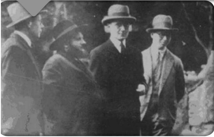
הבית אברהם' מסלונים בביקור בגן החיות