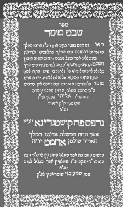
שער הספר 'שבת מוסר' לרבנו אליהו הכהן מאיזמיר, דפ"ר קושטא תע"ב

"כמה טובות הדרשה ברכים אבל צריכה תנאים רבים. זה יצא ראשונה, שיקדים תפלה שינצל מגאווה ומעין הרע, ושיעשו דבריו פירות, וגם יתפלל שיהיה לו לשון למודים לדבר דבריו בנועם שיהי בשפה ברורה באופן שיהיו דבריו ערכים על שומעם ככלה שהיא חביבה על בעלה כמו שכתבו רז"ל. וזאת שנית, שלא יהא מאריך טרחא אלא יהא מקצר ועולה וטוב מעט. ואל השלשה, שיוזהר בכבוד הכריות שלא יבואו לידי הלבנה ברכים בשביל דבריו ולא ידבר עליהם תועה ולא ילמוד עליהם קטגוריא. ויכלול עצמו עמהם באמרו לא טוב הדרך אשר אנחנו הולכים לכו ונלכה באור ד'. וישמר מהחשד שלא יחשדנו שומע שהוא דורש טוב לעצמו, ולכן לא ידבר לדרוש בחיבת עשות צדקה עם בעלי תורה וכבוד תלמיד חכם ומוראם וכדומה. ולעולם יקדים לסדר הדרשה בינו לבין עצמו באופן שתהיה שגורה בפיו שלפניו צריך לרגל איזה דברים שאין ראוי לדרשם ברכים או דברים שאין מוכנים לו לפום ריהטא, ואם יסדרו לא יצטרך להפסיק בנתיים שהוא גנאי לתלמיד חכם, וישמע חכם ויוסף לקח ודבר בעתו מה טוב".