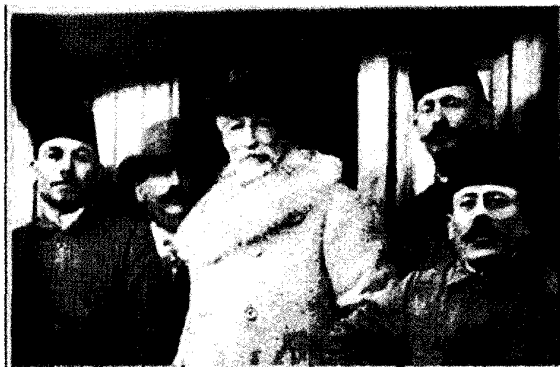
הברון רוטשילד בעת בקורו בארץ עם פקידי