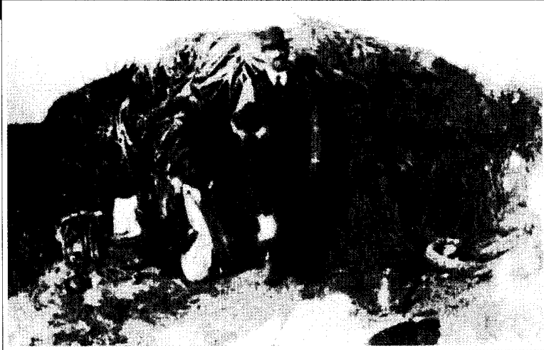
משה דוד גלבמן שגורש מעקרון בפקודת אנשי הברון בגלל סרובו לעבור בשביעית. להגיע לפ"ת וירד לארה"ב עקב מצוקה כלכלית