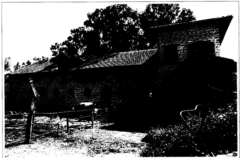
חצר מקידי הברון בעקרון