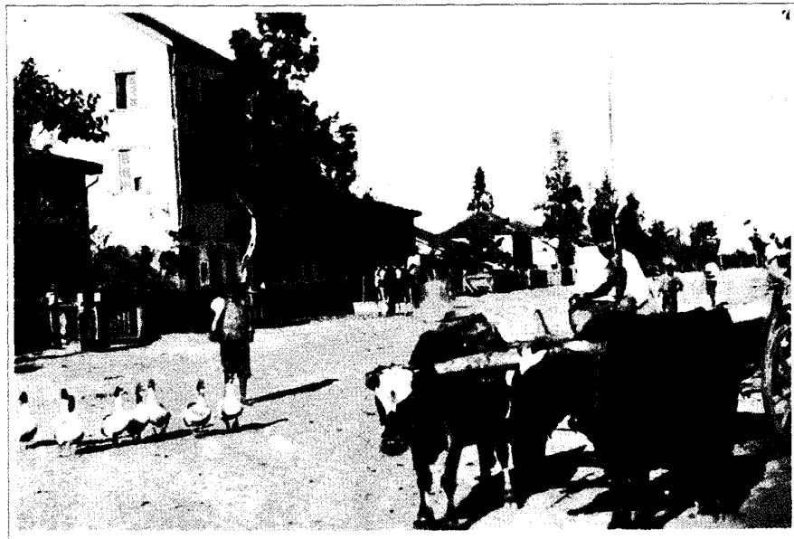
ברחוב הראשי של עקרון

ב"הצפירה" (תרמ"ט גליון 27) מתפרסם מכתב מטעם הכד"צ דכוללות האשכנזים בירושלים בו נאמר: "וכששאלו פקידי המושבות מה דעתם של הרבנים דפה והשיבום כהלכה הגידו בני עקרון תיכף ומיד כי הם ישמרו את השביעית ויעבור עליהם