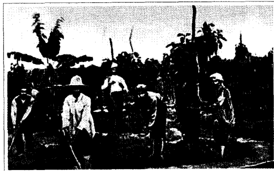
חקלאים שמעבדים את שדותיהם באותם ימים