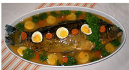
ביהדות אשכנז נהוג לאכול געפילטע פיש

האוכל דג ביום דג ניצל מדג הוא פתגם שמעודד אכילת דגים בשבת, לפי ההסבר: מי שיאכל דג ביום ד"ג כלומר, ביום שבת שהוא היום השביעי (ד"ג בגימטריה שבע), ינצל מד"ג שהוא ראשי תיבות של דין גיהנום.