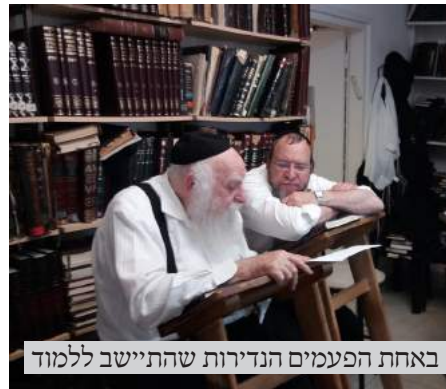
באחת הפעמים הנדירות שהתיישב ללמוד

מצד אחד היה מחדש עצום, כאשר היה יכול לתרגם מיסוד שמצא באגדה תירוצן להלכה, כי