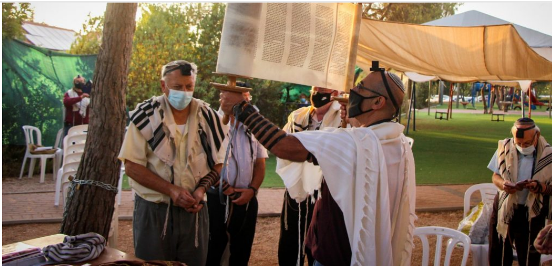
מניין רחובות באפרת, סתיו תשפ"א.