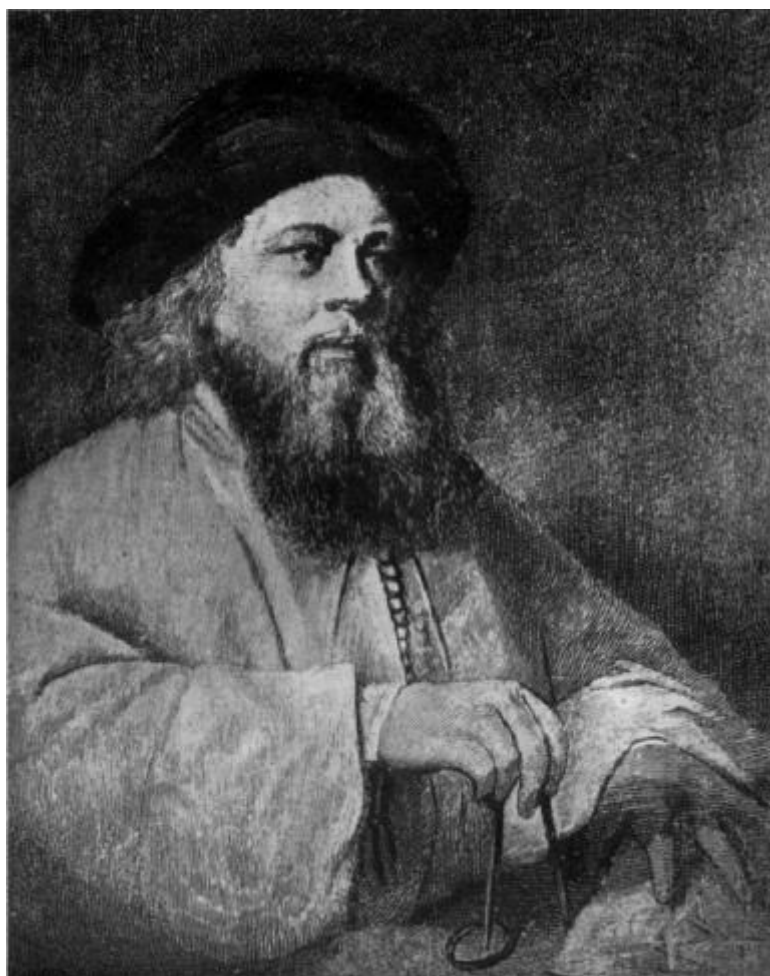
הבעל שם טוב.