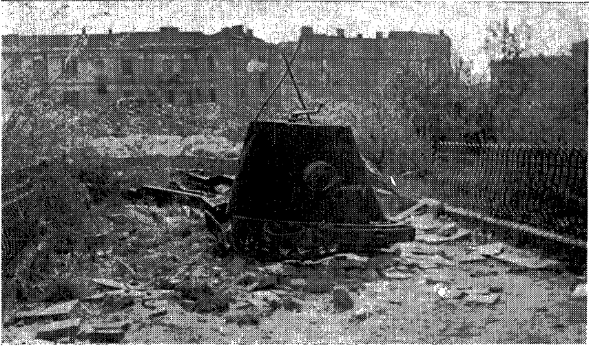
חורבות פון דער „גרויסער שול“ אויף טלאמאצקע גאס