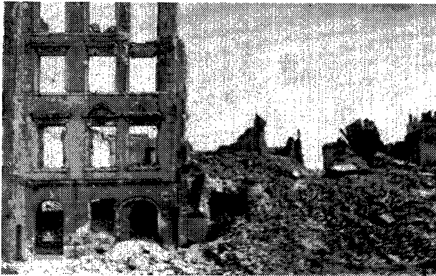
דער איבערבלייב פון קראכמאלנע גאס