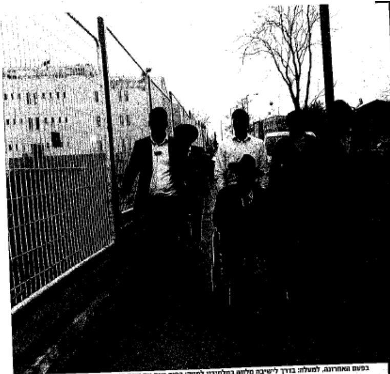
בפעם האחרונה, למעלה: בדרך לשיבה מלחם בחלמידי למשה בסוד שיח עם צוות הישיבה