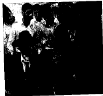
מספר פנים. ביתו המודרני

אותו, מכיוון שהיא הגיעה מתוך אהבה, ומתוך רצון אמיתי וכן להטיב אתו.