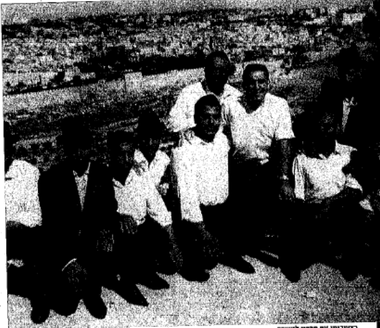
בצעירותו עם חבריו לישיבה