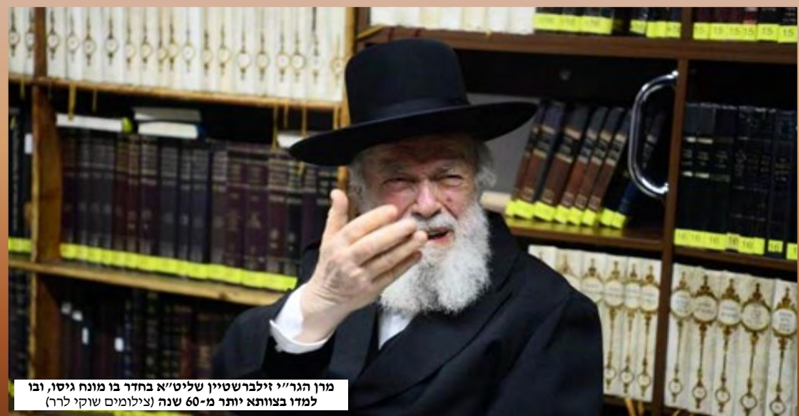
מרן הגר"י זילברשטיין שליט"א בחדר בו מונח גיסו, ובו למדו בצוותא יותר מ-60 שנה

בכל פעם, הרי היה יכול להעיר על כך פעם אחת בראש העמוד, ולבקש שכך ייעשה בכל המלים, וכיון שהספר הוקלד במחשב, נותנים הוראה למחשב שבמקום המילה 'קנייבסקי', יכתוב 'קניבסקי', והבעיה תבוא על פתרונה. את התשובה שהשיב לנו מרן הגר"ח יש לחרוט על לוח-הלב. גם אם הייתי יודע שאפשר לעשות כך,