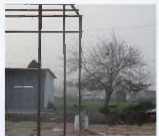
איזה דינים פוסלים את הלחיים האלו?

אתה מוזמן להצטרף אלינו, להבין, לדעת, וגם להתמחות בימים הקרובים מתחילים מחזור חדש - לימוד הלכות עירובין למעשה 12 שיעורים! לימוד מקיף, הלכה, פרקטיקה, סיכומים, מבחן, סיור בשטח, תעודות