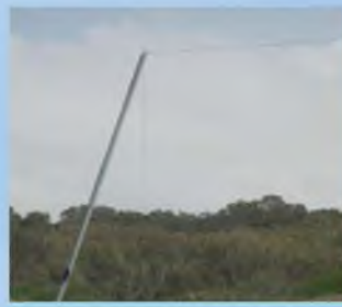
כך נראה העירוב בשוב ר. האם עמוד עקום מאוד, כשר בשעת הדחק?