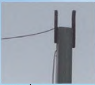
כך נראה החוט בכניסה לשוב מ. ח, כשר או פסול?

את זה תוכל לדעת ולהורות, בהצטרפות ללימוד "עירובין למעשה" שע"י "מוקד העירוב"