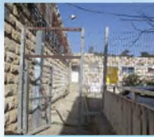
מה הבעיה בפתח הזה, והאם יש אפשרות להתירו?