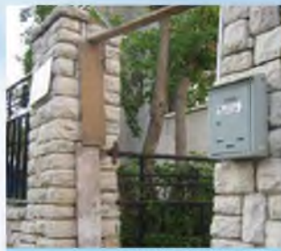
האם העירוב בצימר כשר בצורה כזו?