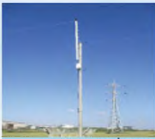
עירוב ליד ישוב חפץ חיים - כשר או פסול?