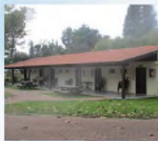
האם יש היתר לשלטל תחת הגג?