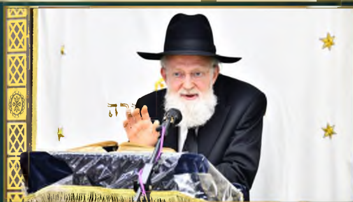
בנסי התעודות בביהמ"ד שערי תבונה ובביהמ"ד המרכזי בשכ' תל ציון, בדאשזות ראש הישיבה הגאון רבי שלמה קניבסקי שליט"א