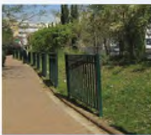
האם ניתן להתיר גדר זו ע"י "עומד מרובה"?