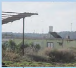
זה מה שהאחראי הראה לנו, היכן העירוב בתמונה?