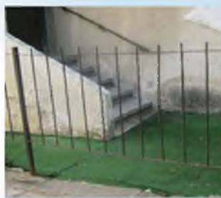
מה צריך לדעת למדוד בגדר זו?