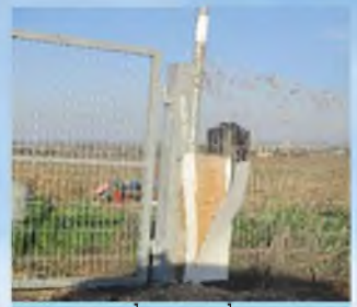
כך נראה הלחי סמוך לשוב ח. מה דין הלחי במצב כזה?