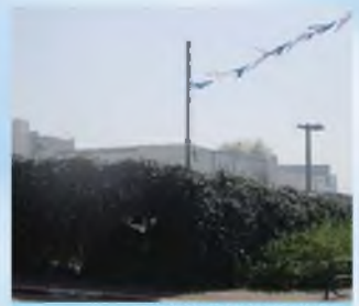
עמוד שמוקף בצמחים, מה דינו לכתחילה ובדיעבד?