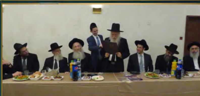
הגאון הגדול רבי אשר אריאלי שליט"א בדרשת חג בפזנוביו לצעירים