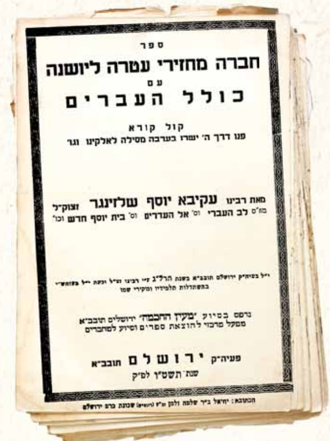
מדובר למעשה כהכרזה על הקמת מדינה מבלי לקרוא לדבר כן בפירוש. השער המכריז על 'כולל העברים'

פעם, משנשאל כ"ק מרן אדמו"ר ה'שפע חיים' מצאנז זי"ע מהיכן נובעת אהבת הגדולה לארץ הקודש, הוציא הרבי ממגרת שולחנו את הספר 'מחזירי עטרה ליושנה' בו רשם רבי עקיבא יוסף את הפרטים להגשמת חזונו הגדול. הרבי אמר: "לספר קטן הכמות הזה ולמחברו היו השפעה עצומה עלי... הדברים הרשומים בספרא הדין, הם אלו שהביאו אותי להיות מקושר נפשית לארץ הקודש ולשאוף בכל מאודי לחיות בה... הלוואי והיו שומעים לקולו באותו הזמן בו פרסם את ספרו, או אז היתה כל תמונת העולם היהודי שונה לחלוטין!".