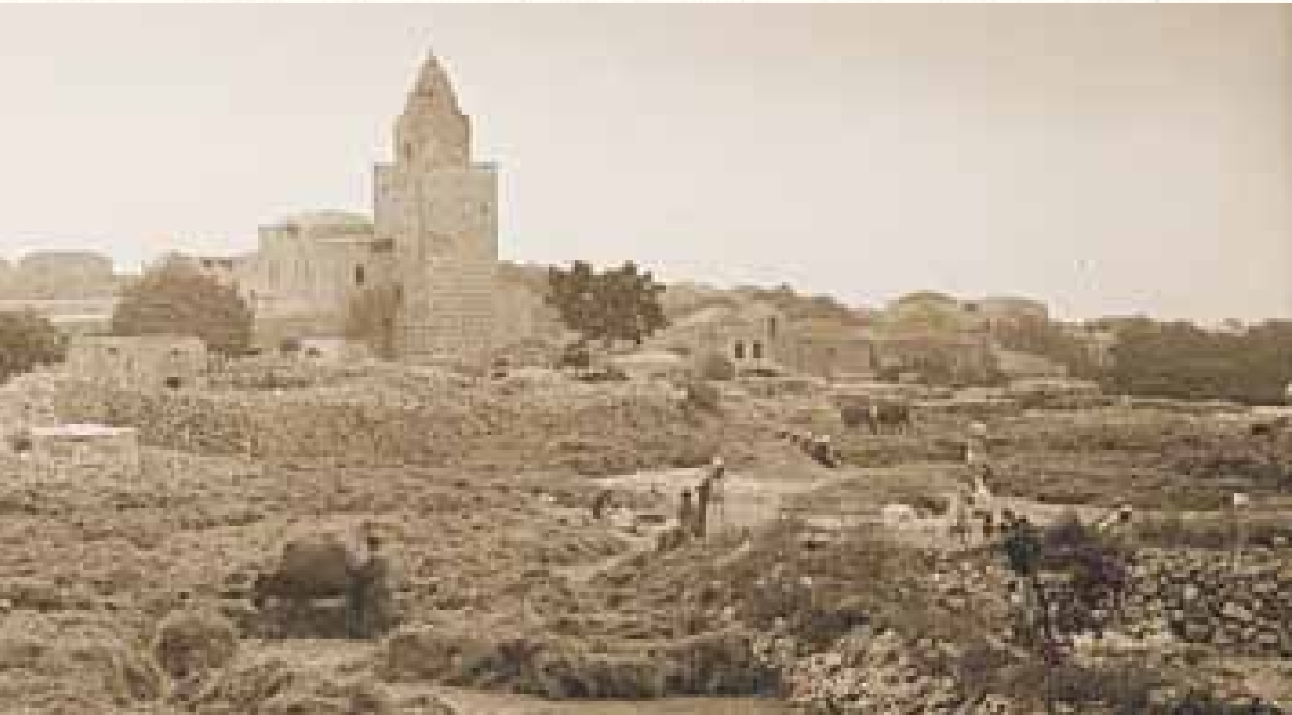
הוא ממליץ לרכוש את האזורים שסמוכים לקברים הקדושים כדוגמת קבר 'נתן הנביא'. אזור כפר חלחול שם טמון נתן הנביא

לא נוכל במסגרת זו להביא את כל הרעיונות אותם מביא רבנו במחברתו. הוא כותב כיצד צריכים להיראות החיידרים ותלמודי התורה, כמה ילדים צריכים להיות בכל כיתה, וכיצד יש לבחור מלמד לכל כיתה. הוא כותב כיצד צריכים להתנהל צוותות החינוך, הישיבות, כוללי האברכים, וכיצד יש לבחור מתוכם מורי הוראה, ומה המסלול אותו עליהם לעשות עד שיגיעו להורות הוראה ביש־