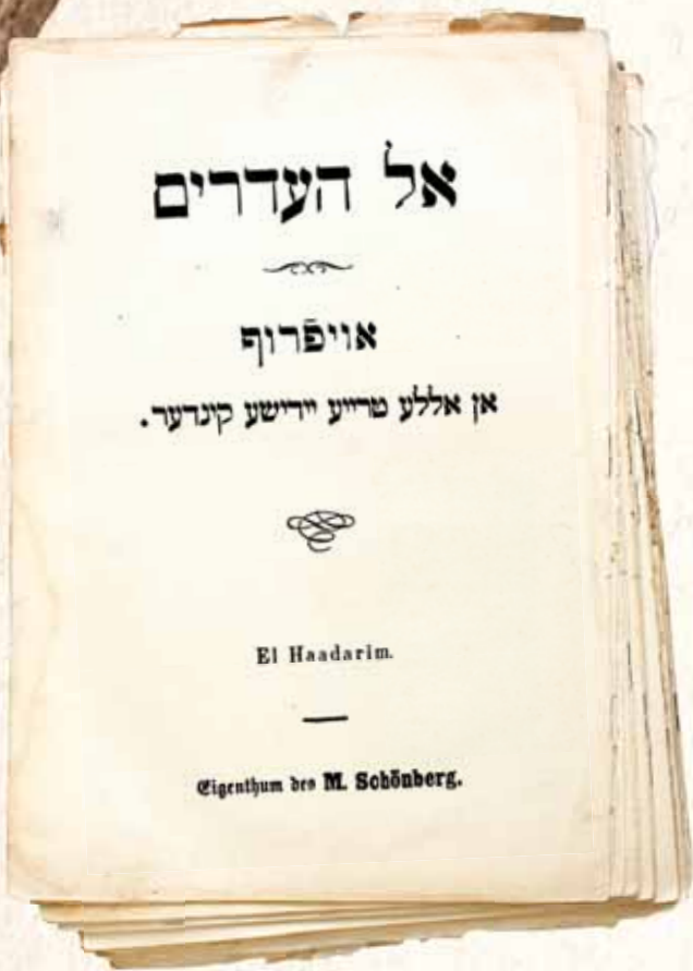
נועד להרחיק את ההמון מזרם ההשכלה המשתולל. 1900 של רבינו 'אל העדרים'

הוא ביקר גם אצל הרה"ק המגיד רבי אברהם מטריסק, ורגיל היה לשגר לו