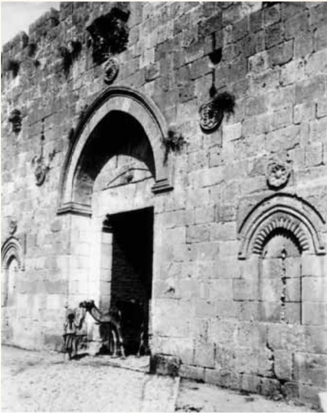
לונכח זאת הם נפרדו איש מעל אחיו, ורבינו נכנס אל העיר דרך שער ציון. מראה 'שער ציון' בירושלים בשנת תרנ"ח

רק בשלב זה התעוררו יהודים מחוץ לארץ ושיגרו את הכסף החסר, אך היה זה מאוחר מדי, הקרקע כבר עברה לרשותו של המוסלמי, אשר כעת דרש סכום מופרז מאוד על כל חלקת אדמה, וכבר לא היה זה כדאי לקנות את המקום מידיו. כאב גדול כאב רבנו על כך שהעסקה לא יצאה בסופו של דבר לפועל. עד סוף ימיו הוא כאב את הדבר, ואף הותיר בכתב־יד קדשו צוואה בה כתב: "ישועה גדולה תלויה בגאולת אדמות אלו, ואיני יכול לפרט את הדבר. לכשיעזור השי"ת ואני או אחד מיוצאי חלציי ישתדלו לפדות אותה, יבינו מה הייתה החשיבות לקנותה אותה".