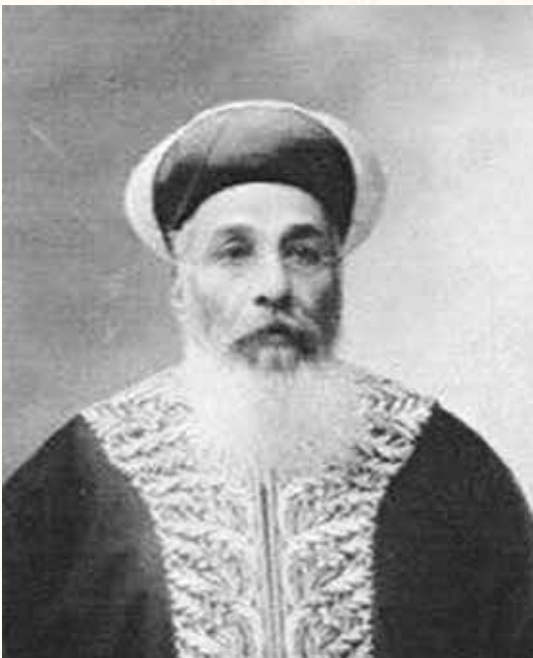
רבינו נסע יחד עם הרב סלימאן מני בנו של הגאון רבי אליהו מני. רבי סלימאן מנחם מני

את מיטב כוחותיו, אנו ומרצו השקיע רבי עקיבה יהוסף בהרחבת גבולות היישוב בארץ ישראל, כשהוא רואה בדבר זה את הגאולה העתידה || רבנו לא נח ולא הרפה מפעילותו למען יישוב ארץ ישראל בנקודות מגורים שונות || פרק מלא הוד, מסירות נפש ויגיעה אינסופית למול מתנגדים רבים וכישלונות אינסופיים. ברם, המטרה הנעלה היא שמניעה אותה במפעל הקודש