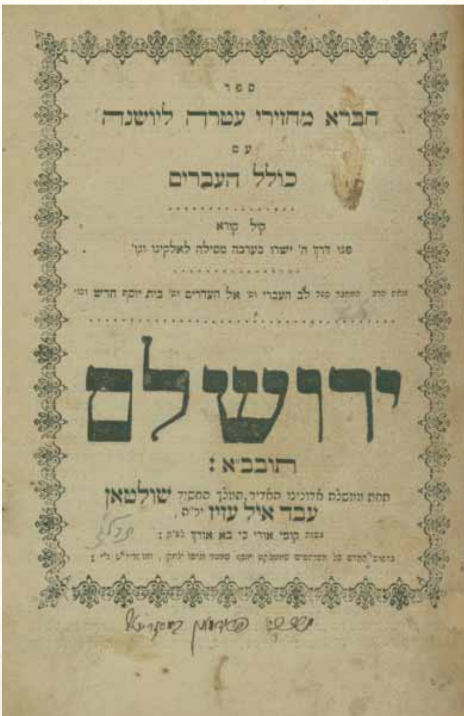
את תוכניתו המפורטת הוא כותב בחוברת 'מחזירי עטרה ליושנה' שראה אור בשנת תרל"ג. שער החוברת

רבנו משרטט תכנית מסודרת של יישוב חדש אותו הוא מכנה בשם 'כולל העבריים' || את תכנית הפעולה המקיפה והמדויקת העלה על הכתב בחוברת 'מחזיר עטרה ליושנה' || הוא מתייחס בתכנית לכל פרט ופרט - החל מענייני לבוש וחינוך, עד למקורות פרנסה, חברת ביטוח, דירות להשכרה והקמת המוביל הארצי - רעיונות שאומצו בסופו של דבר אבל לא ביוזמתו