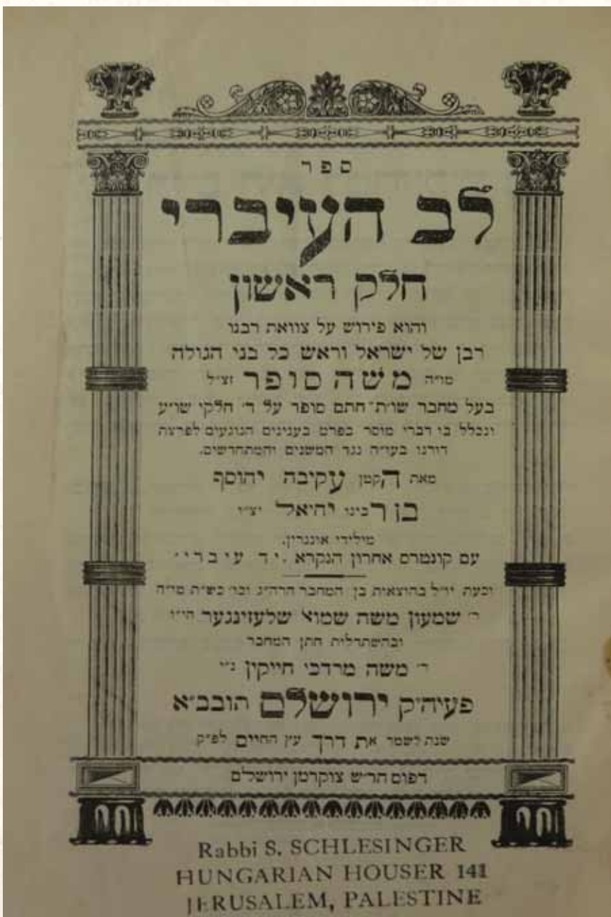
ספרו המפורסם אשר על שמו הוא אף נזכר לדורות. שער 'לב העיברי' במהדורת ירושלים

רבנו הותיר אחריו ברכה את ספריו הרבים העוסקים בכל מקצועות התורה || עשירים הם בהיקף ובחכמה, בעמקות, בבקיאות ובגאונות, והלומד בהם מתפעל מהעושר העצום ומהידע הנרחב הבא לידי ביטוי בכל ספר מספריו || מ'צוואת משה' ו'נער עברי' עד 'לב העיברי' וספר השאלות והתשובות שהורכב ממאות אלפי תשובות שהשיב רבנו למחלי פניו בדבר הלכה