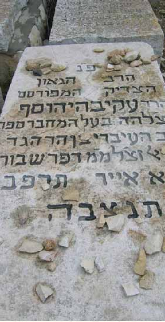
הרב הגאון הצדיק המפורסם. מצבת קברו של רבינו בהר הזיתים בירושלים