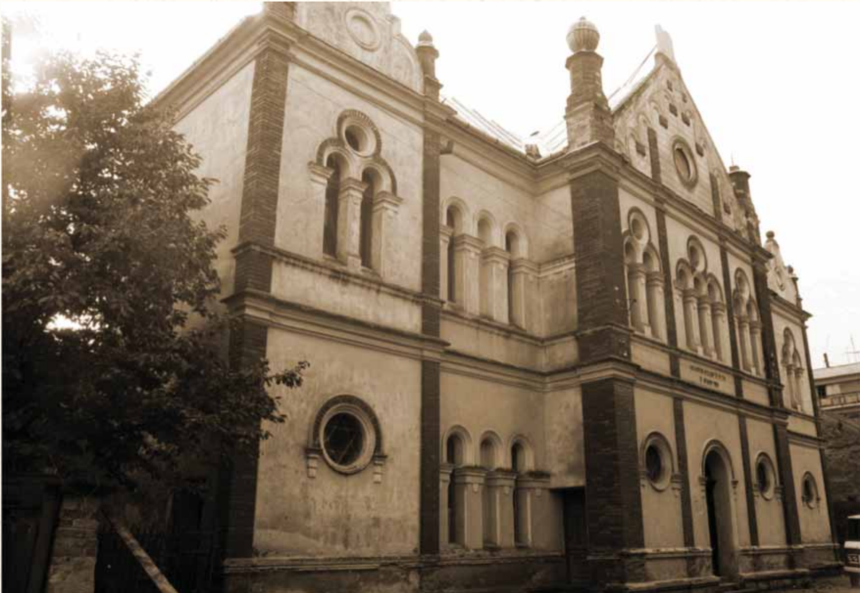
בנסיעתו עברה מרכבתו דרך העיר סיגעט. בית הכנסת בעיר סיגעט

הגיב רבי הלל בביטול ואמר: "אם כן שלח את בעל החלומות אלי!" לא עברו ימים ספורים ורבי הלל נוכח לדעת כי דבר אמתו הוא.