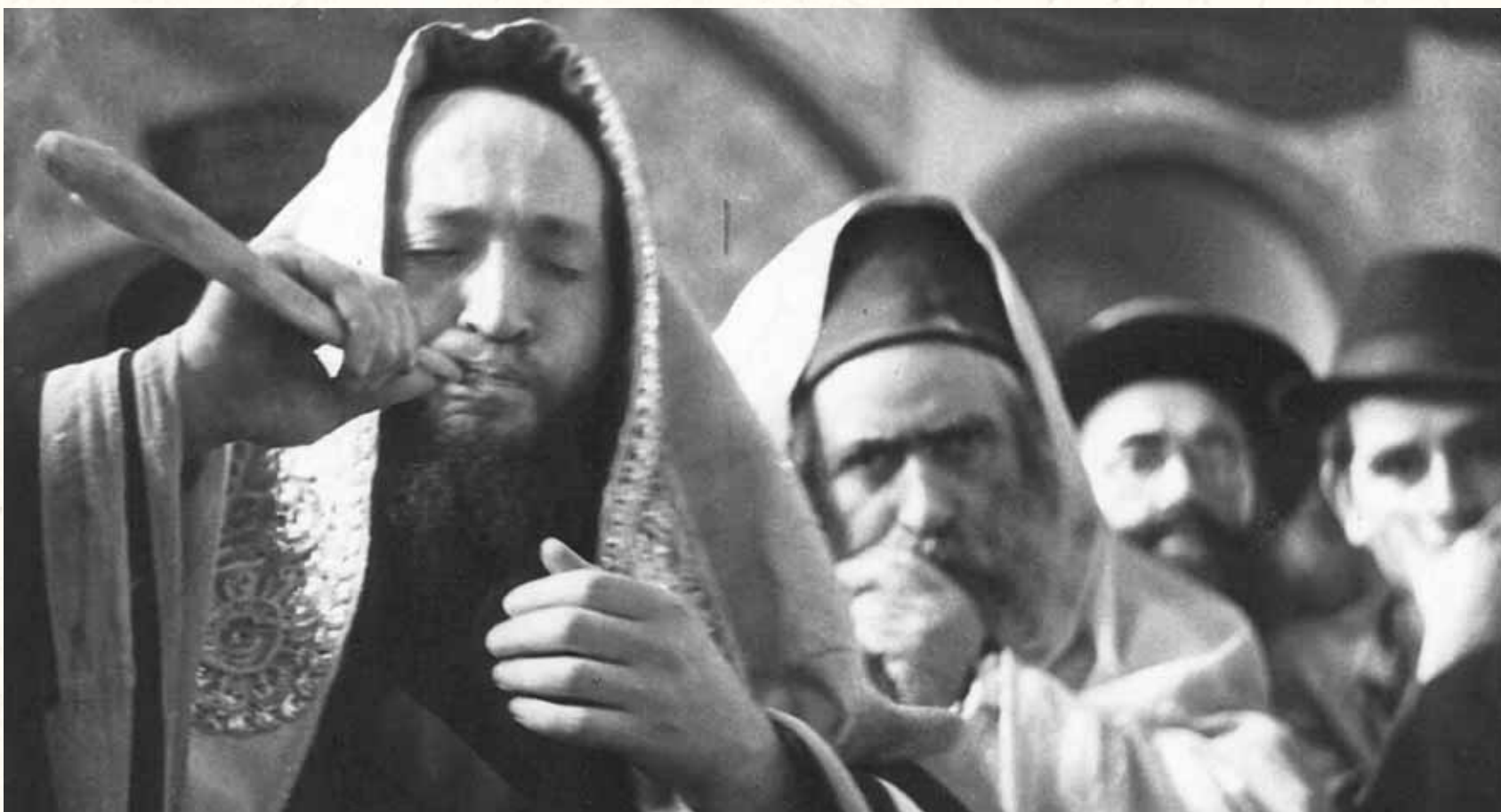
תוכניתו הייתה לכנס את כל אנשי ירושלים לאחד מבתי הכנסת החשובים כדוגמת 'חורבת רבי יהודה החסיד' ולתקוע בשופר שלשים קולות. תקיעת שופר בבית הכנסת 'חורבת רבי יהודה החסיד' ביום תפילה להצלת יהדות אירופה

שמו של רבנו נקשר בחידושים הלכתיים מיוחדים, כשגישתו המעשית והפרקטית הניבה חידושים עצומים בכל מקצועות התורה || בדעתו הגדולה השיג השגות רבות וביקש להנהיג את הדברים בשטח ובחיי המעשה. חלק מאותם חידושים אף יושמו הלכה למעשה בשנים הבאות עלידי הנוהגים לפי דרכו