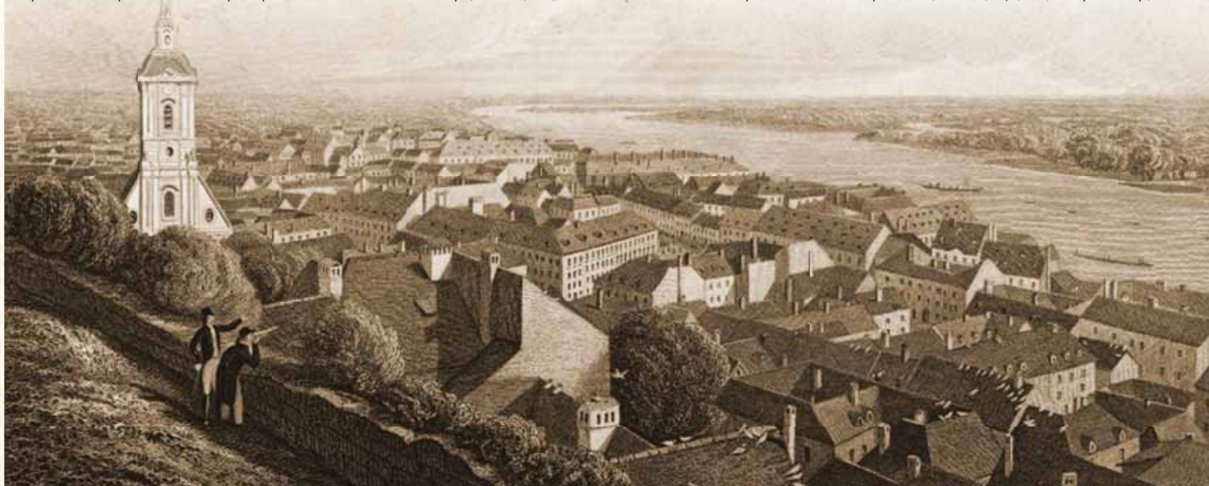
בעיר זו המלאה בחכמים וסופרים עמדה עריסתו של הגאון הקדוש. העיר פרשבורג בשנת תקפ"ג