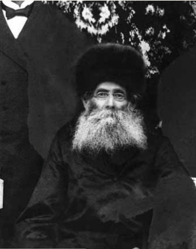
נאנח מאוד האדר"ת ואמר: "חבל שראש השנה של שנת תרס"ה חל בשבת". תמונה נדירה של האדר"ת

להו" וכפי שפירשו רש"י ותוס' - מה שאומר כי בני ארץ ישראל חייבים מדאורייתא ביום אחד של ראש השנה ובני חו"ל בשני ימים מעיקר הדין, אם כן יש מקום לומר שישנו חיוב המוטל על כל יחיד לתקוע באם הוא יכול לתקוע, ובאם לא יניחו לו לעשות כן נמצא שהוא גורם לעצמו בנסיעה זאת לבטל ממנו מצוות עשה של שופר מן התורה בארץ ישראל, משא"כ בחו"ל עליה נאמר "הא להו" והשני ימים כיומא אריכתא דמי. וכן "מצוות עשה של ישיבת א"י בזה"ז לדעת הרמב"ם הינה רק מדרבנן, ולבטל משום כך מ"ע דאורייתא בקום ועשה, שב ואל תעשה עדיף".